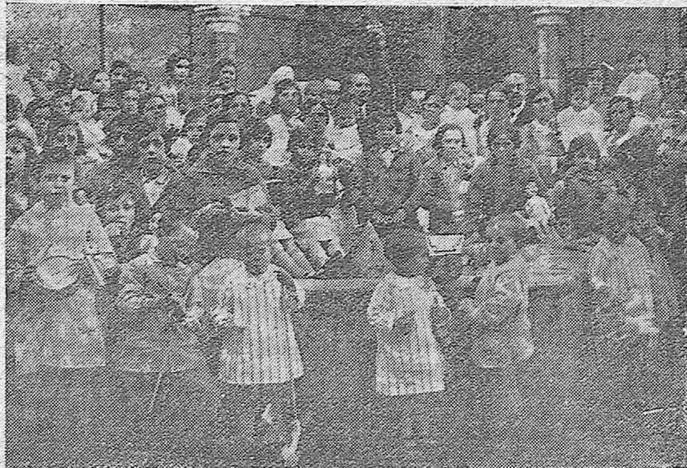
LA DIPUTACION Y LOS NIÑOS POBRES. —El presidente y algunos miembros de la Comisión gestora provincial, después del reparto de juguetes a los niños de la Casa provincial de Expósitos, verificado ayer con motivo de la Pascua de Reyes