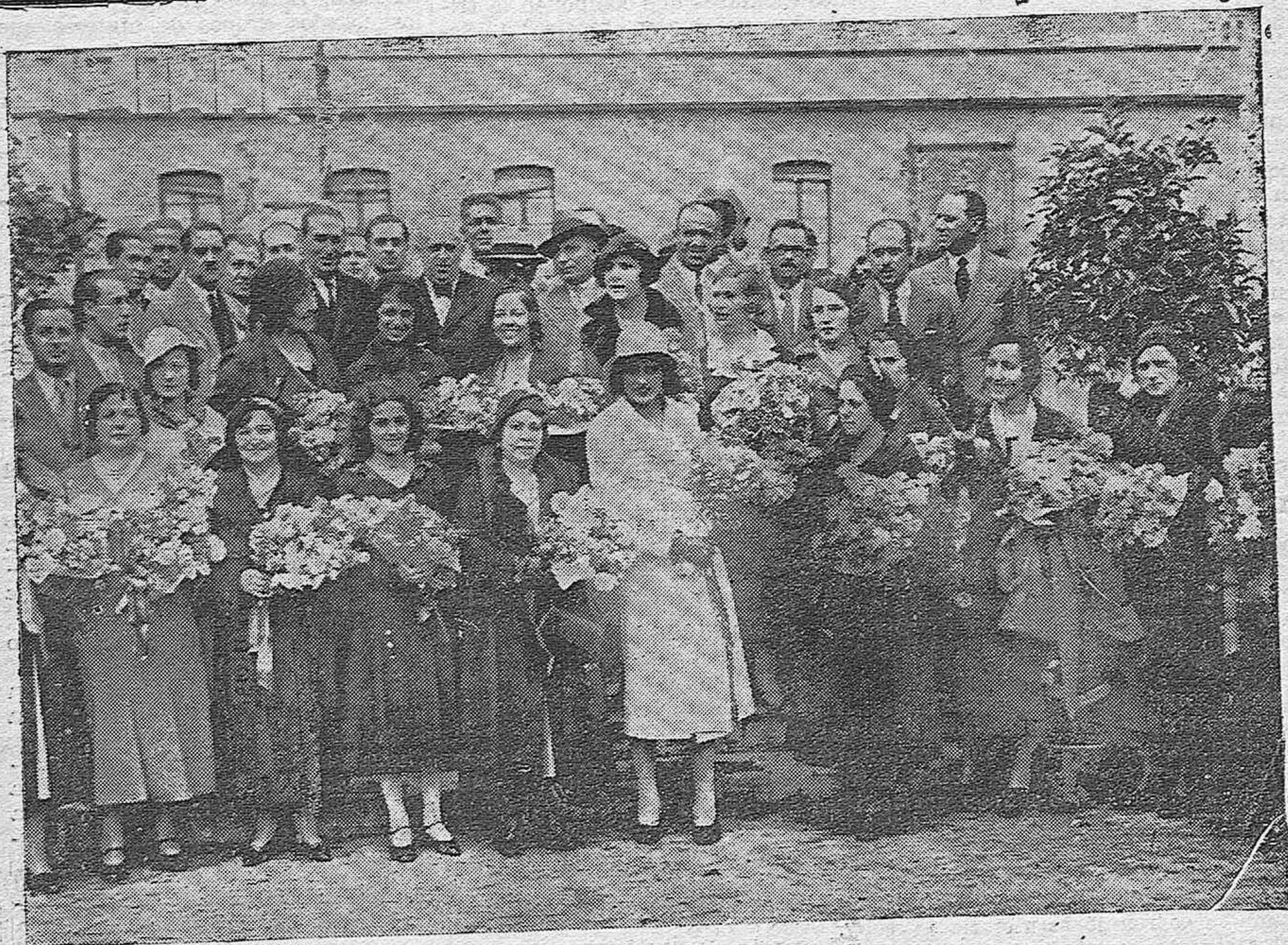
MISS ARGENTINA EN CORDOBA. —El alcalde, concejales, periodistas y otras personas rinden tributo de admiración a la belleza argentina, entregando preciosos ramos de flores a aquella y a las señoritas que la acompañan

Córdoba, 30 de Marzo de 1933.— El Secretario, A. García.