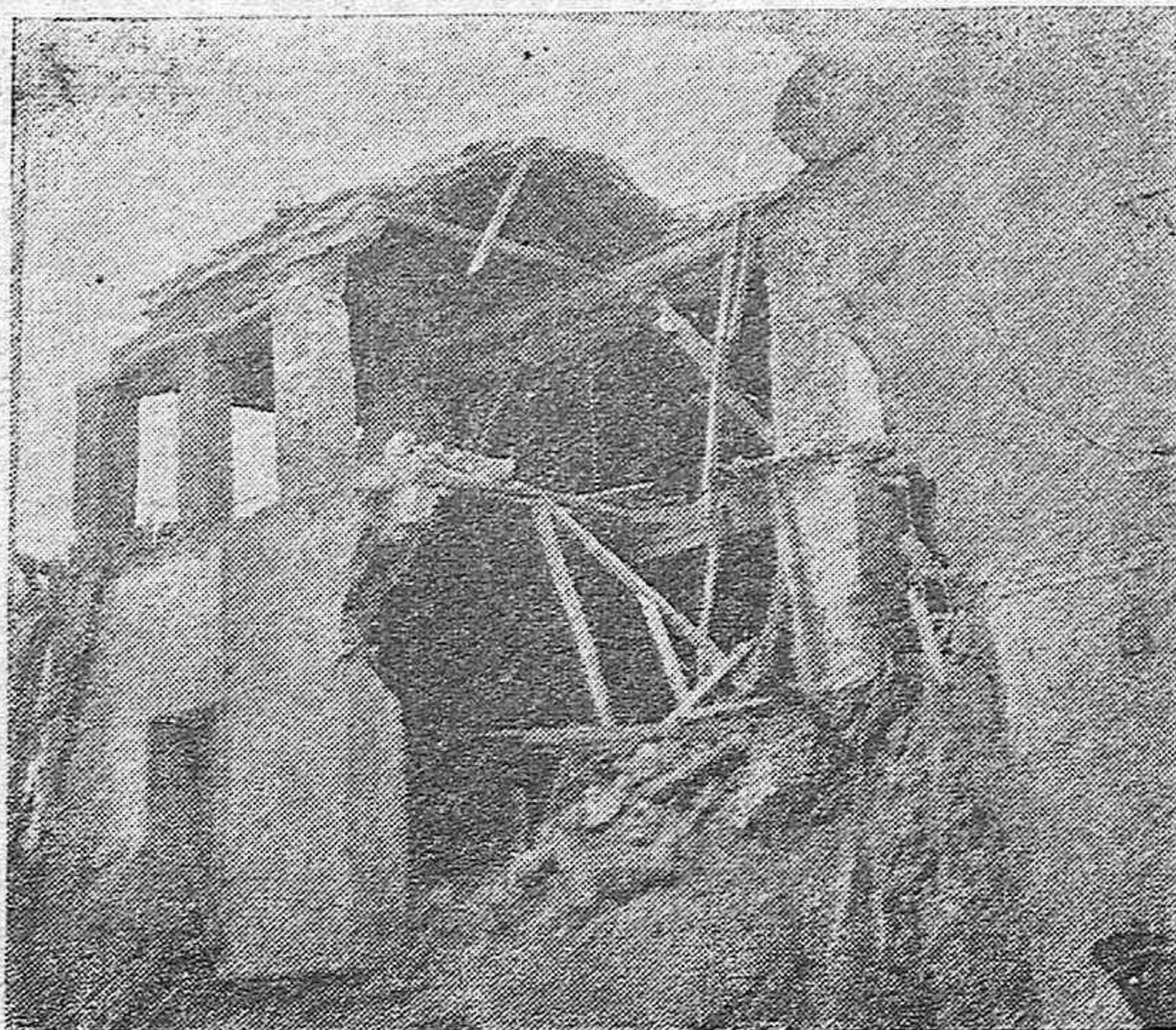
Una casa de un barrio obrero de Cabra donde cayó una bomba, produciendo numerosas víctimas

En Córdoba, donde está hospitalizado, continúa en igual estado el Teniente de Regulares, Enrique Montoya, advirtiéndose síntomas de mejoría en medio de la gravedad de sus lesiones.