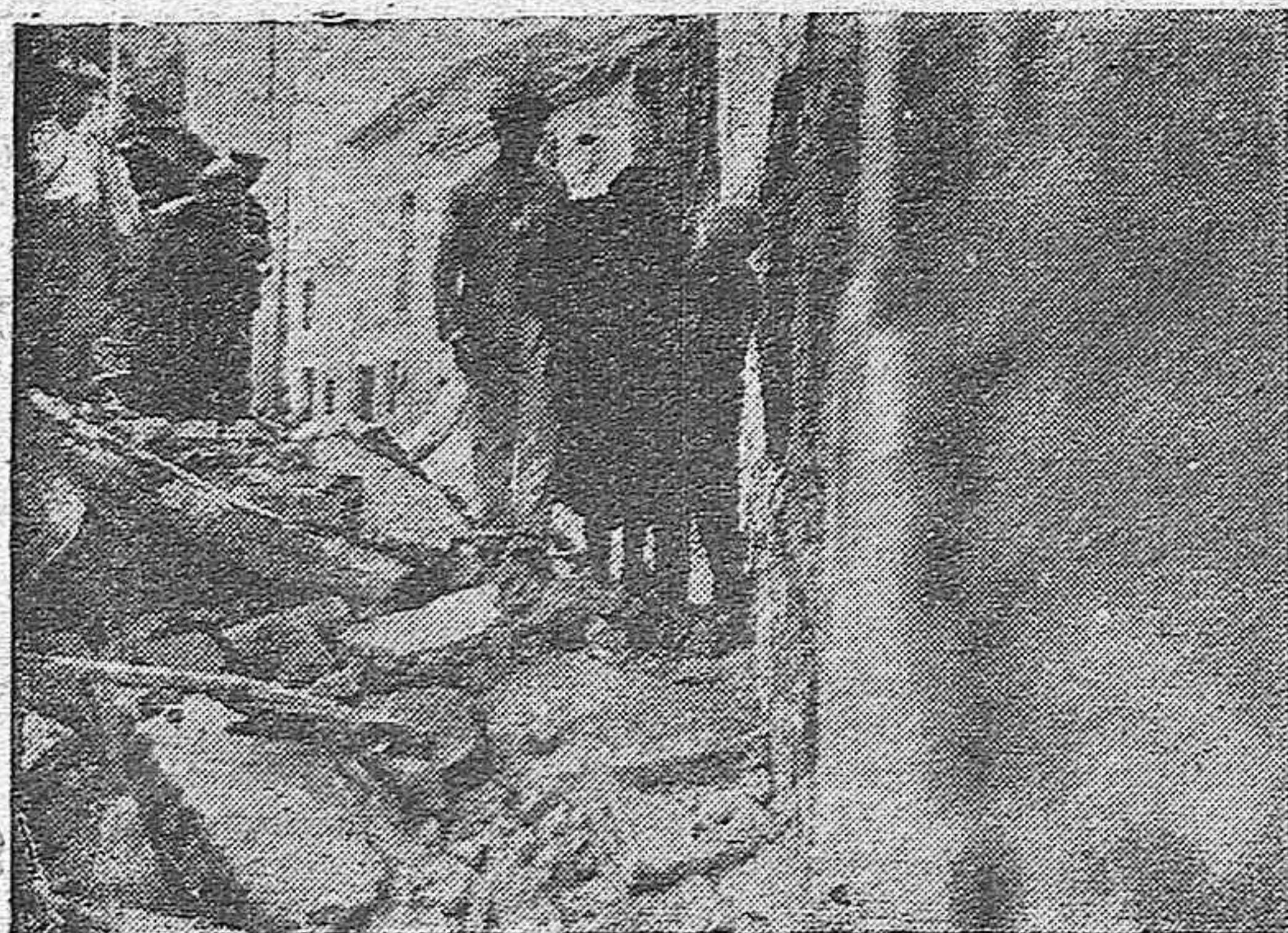
Una pobre mujer marcha al Hospital acompañada de dos familiares. Ha sido ametrallada por los aviones rojos cuando trabajaba en el Mercado

se entere de este vandálico suceso de Cabra. Que no se disfracen de diplomáticos los lobos que acechan sobre las tierras de España. Cuando traten los marxistas de esgrimir argumentos hipócritas, Cabra, con sus mujeres, sus niños y sus ancianos asesinados, será el más ocurrente mentís para esa criminalidad roja que hoy opera en España y que amenaza al mundo.