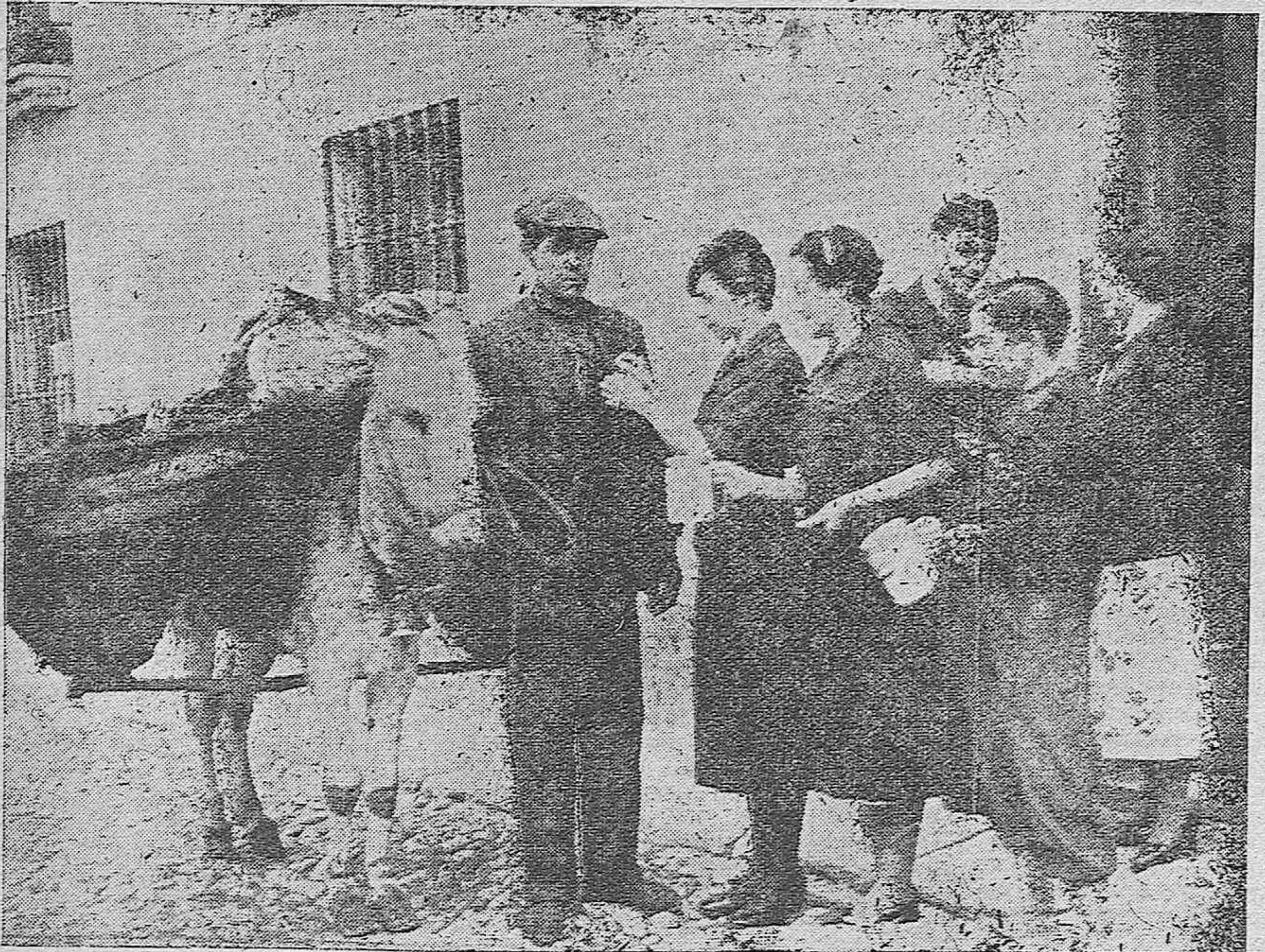
Las camaradas de la Sección Femenina han postulado hoy a favor del "Auxilio de Invierno". Todas las clases sociales, han colaborado con su donativo. He aquí a las postulantes, colocando un emblema a un niño de del castizo barrio de Santa Marina.