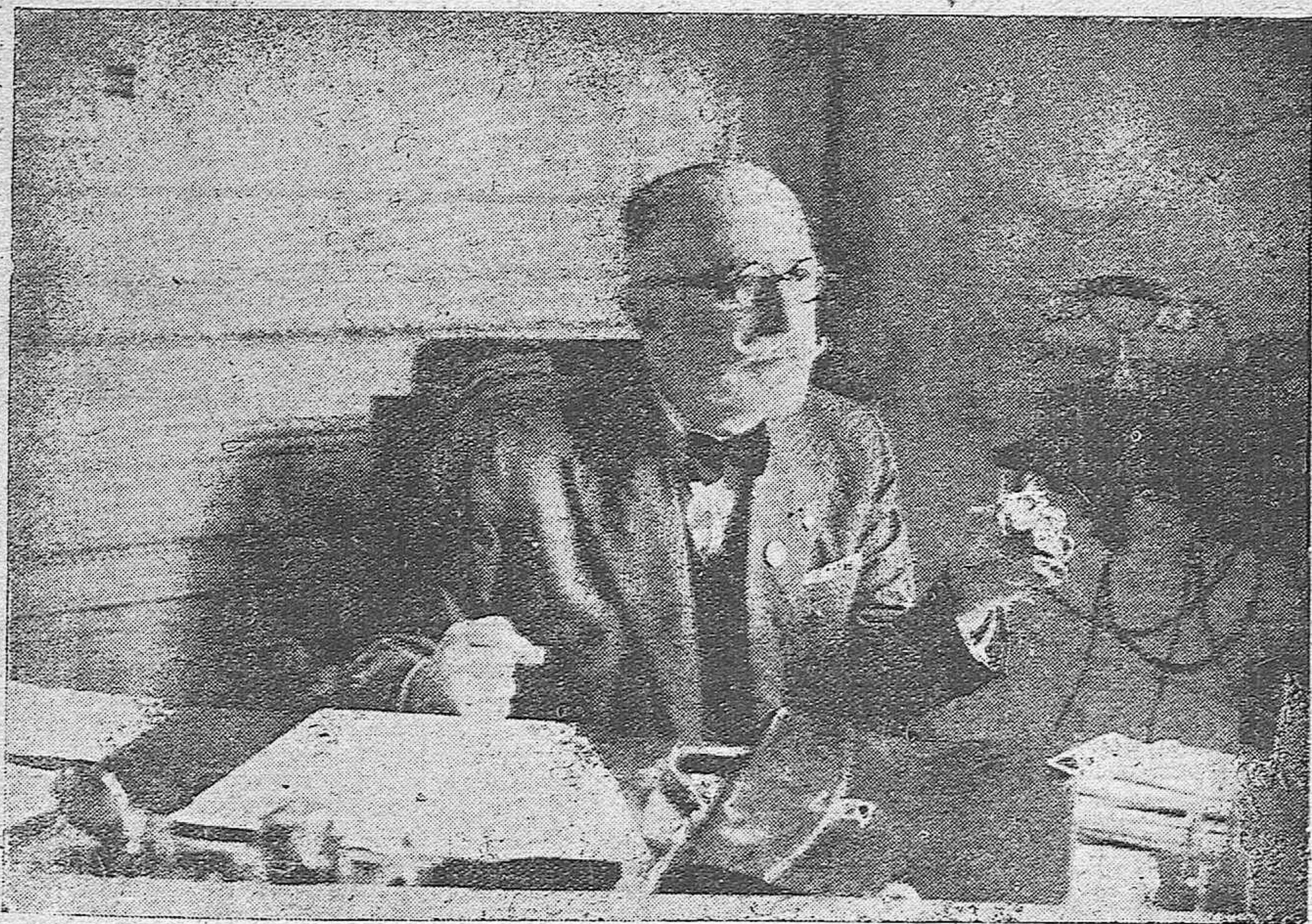
El Gobernador Civil de Córdoba don Eduardo Valera Valverde, prestigiosa figura de la que tanto espera la provincia.