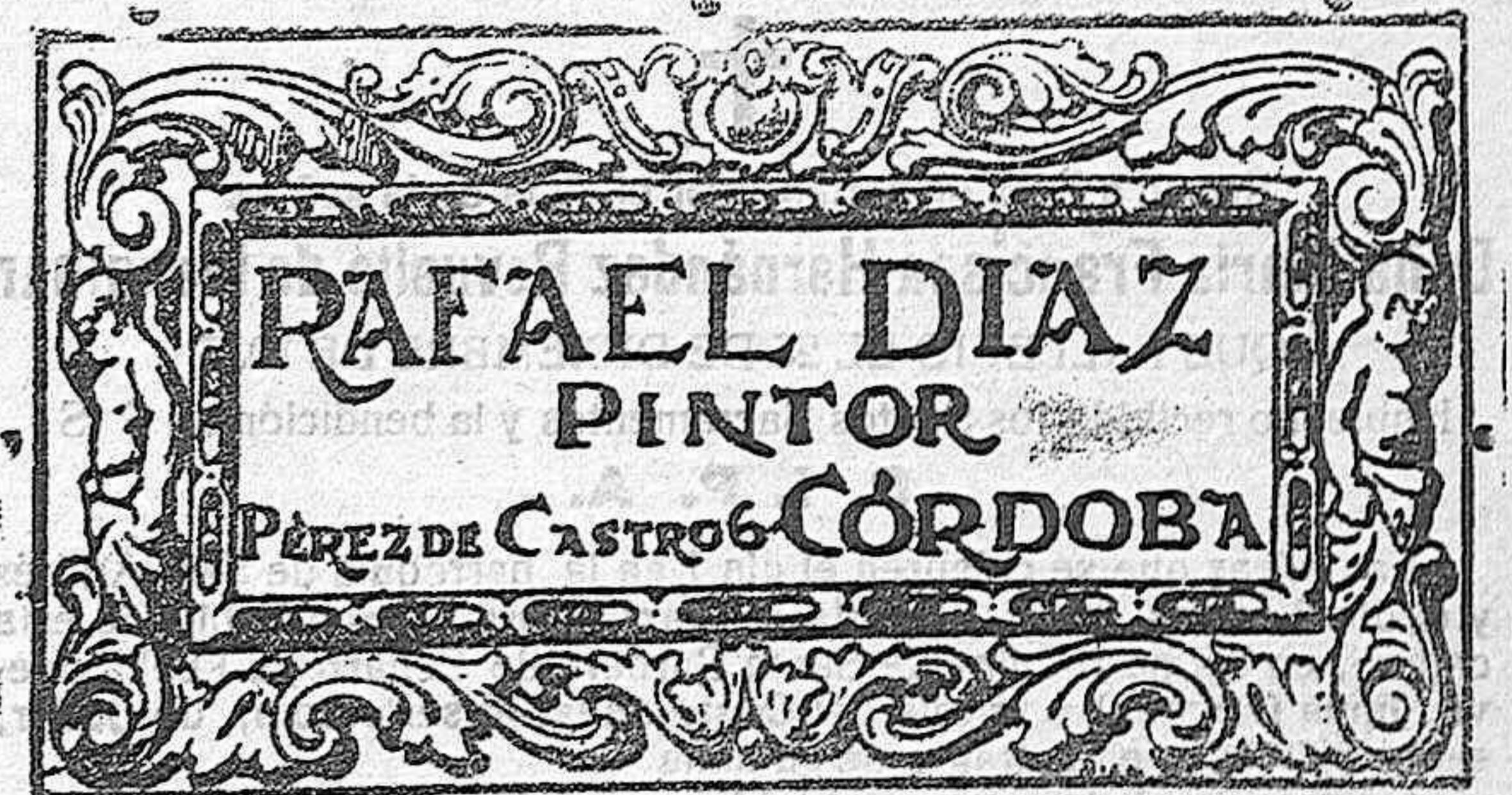
TALLA-DORADOS-RESTAURACIONES PAPELES PINTADOS - Tº 2122