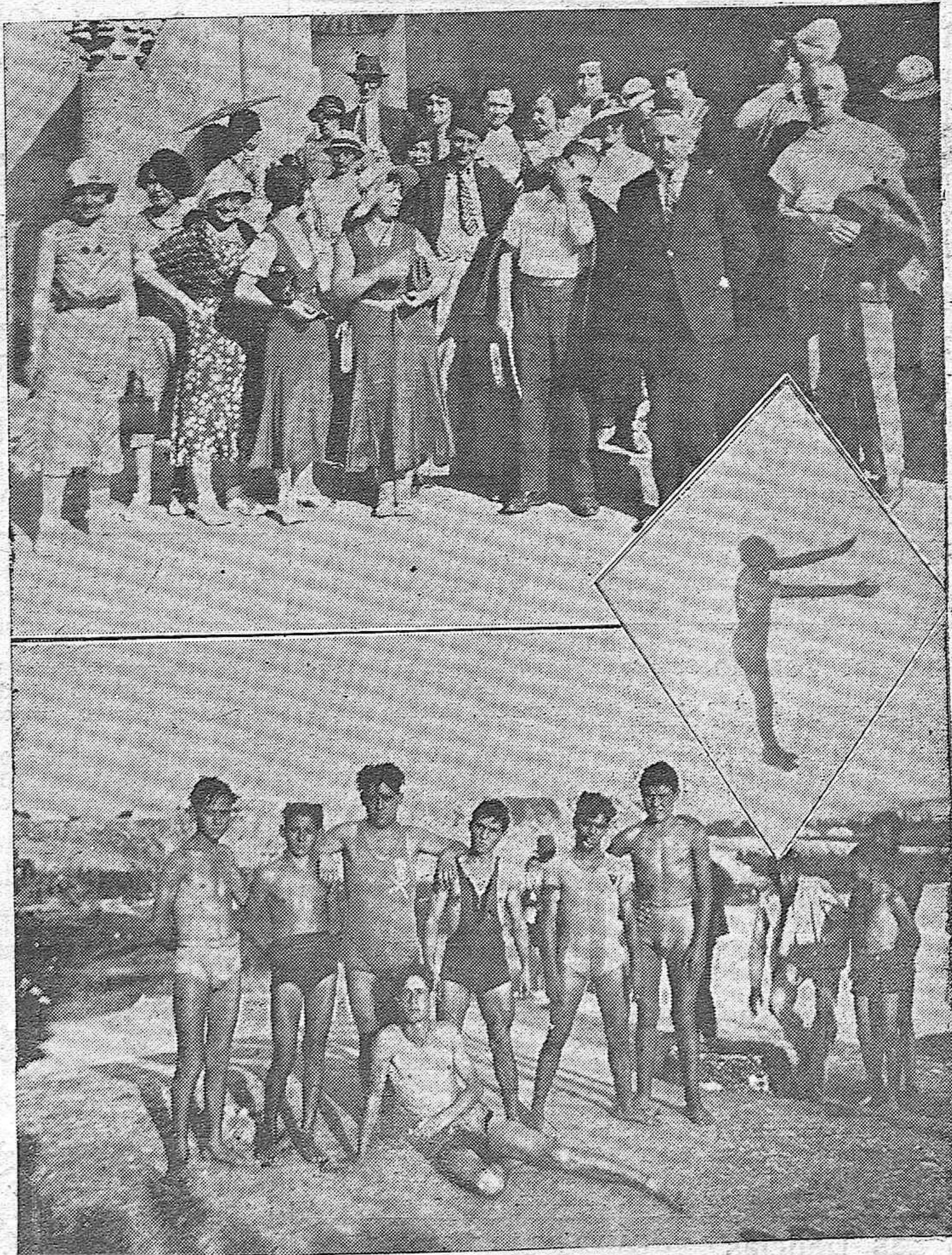
NOTAS GRAFICAS.—Profesores y alumnos de la Escuela Oficial de Instituciones Francesas que han llegado a nuestra capital para estudiar el arte árabe. Del concurso de saltos en el Molino de Martos. Los concursantes. Un momento del concurso