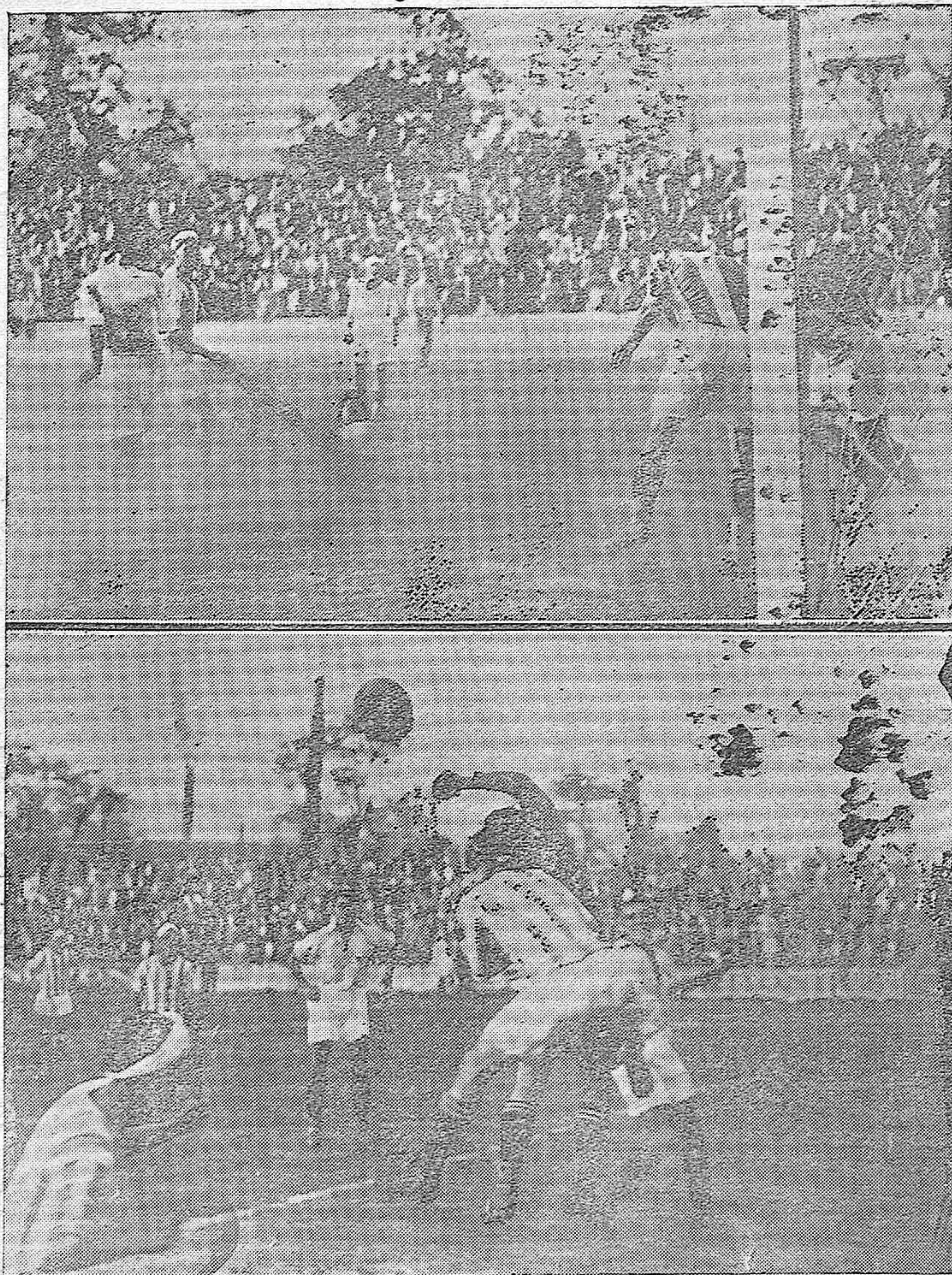
EL ENCUENTRO DE AYER TARDE.—Un momento comprometido ante la meta racinguista, que salva la defensa local muy bien.—Omist despeja acosado, una pelota difícil