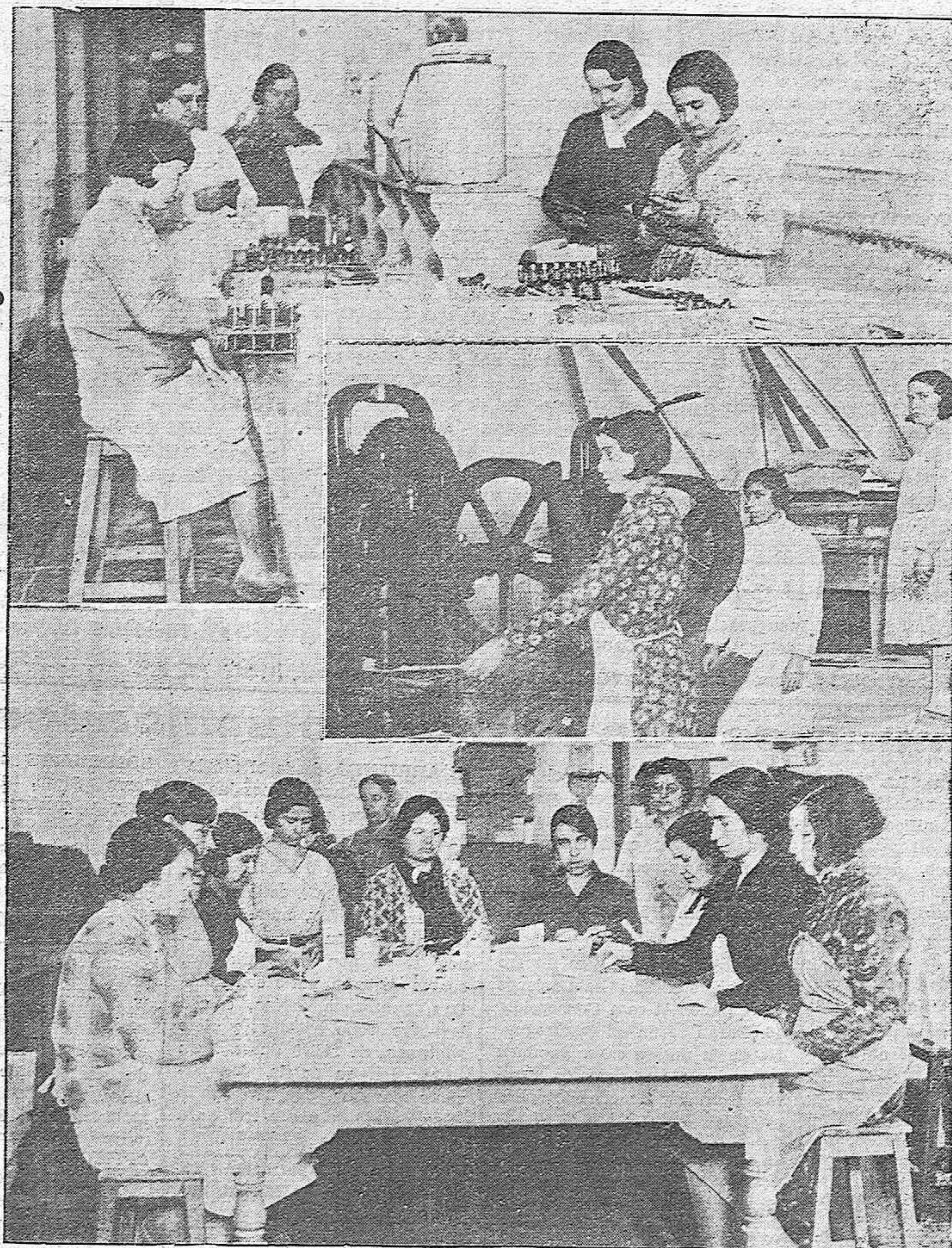
LAS INDUSTRIAS CORDOBESAS Y LA MUJER.—Grupo de operarias de "Besoy" en el envasado de perfumería.— Fabricando los específicos comprimidos.—Un aspecto de la sección de empaquetado del afamado purgante "Besoy".