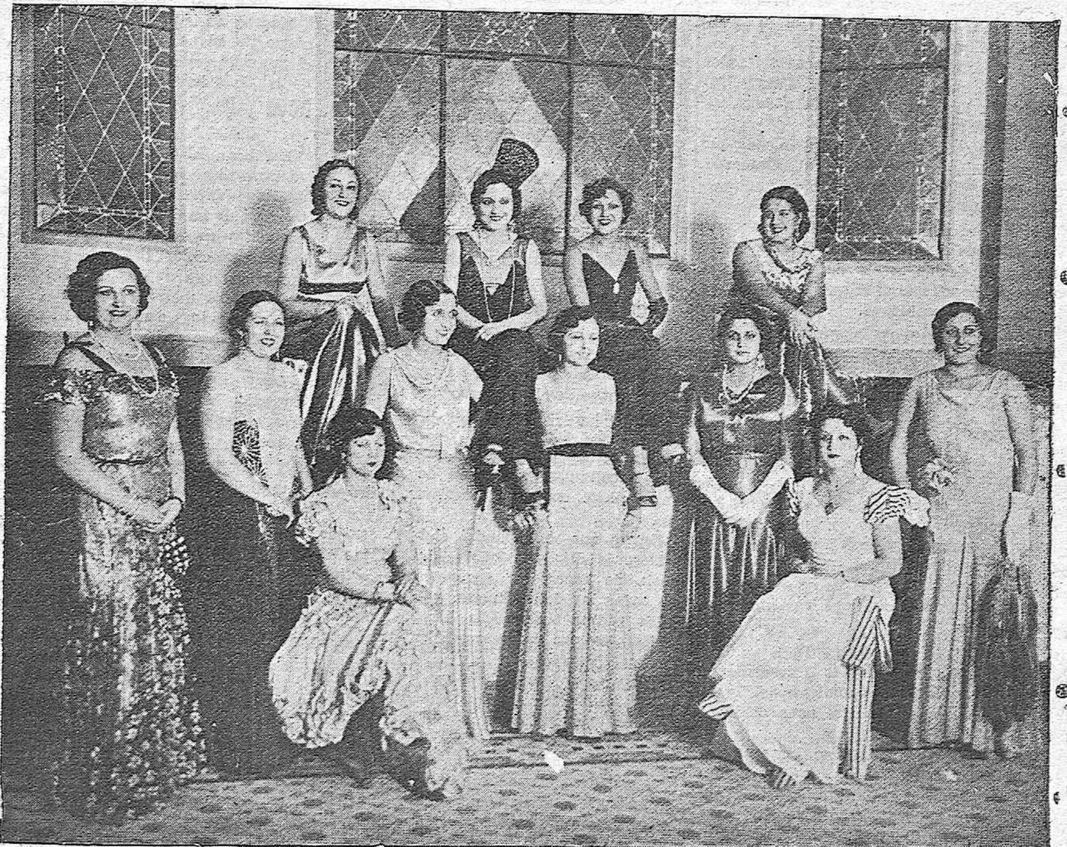
MADRID.—He aquí, lector, un "escaparate" que "tira de espaldas". Son las representantes de la belleza de las distintas regiones españolas, en el acto del concurso en el que resultó elegida "Miss España" la señorita catalana