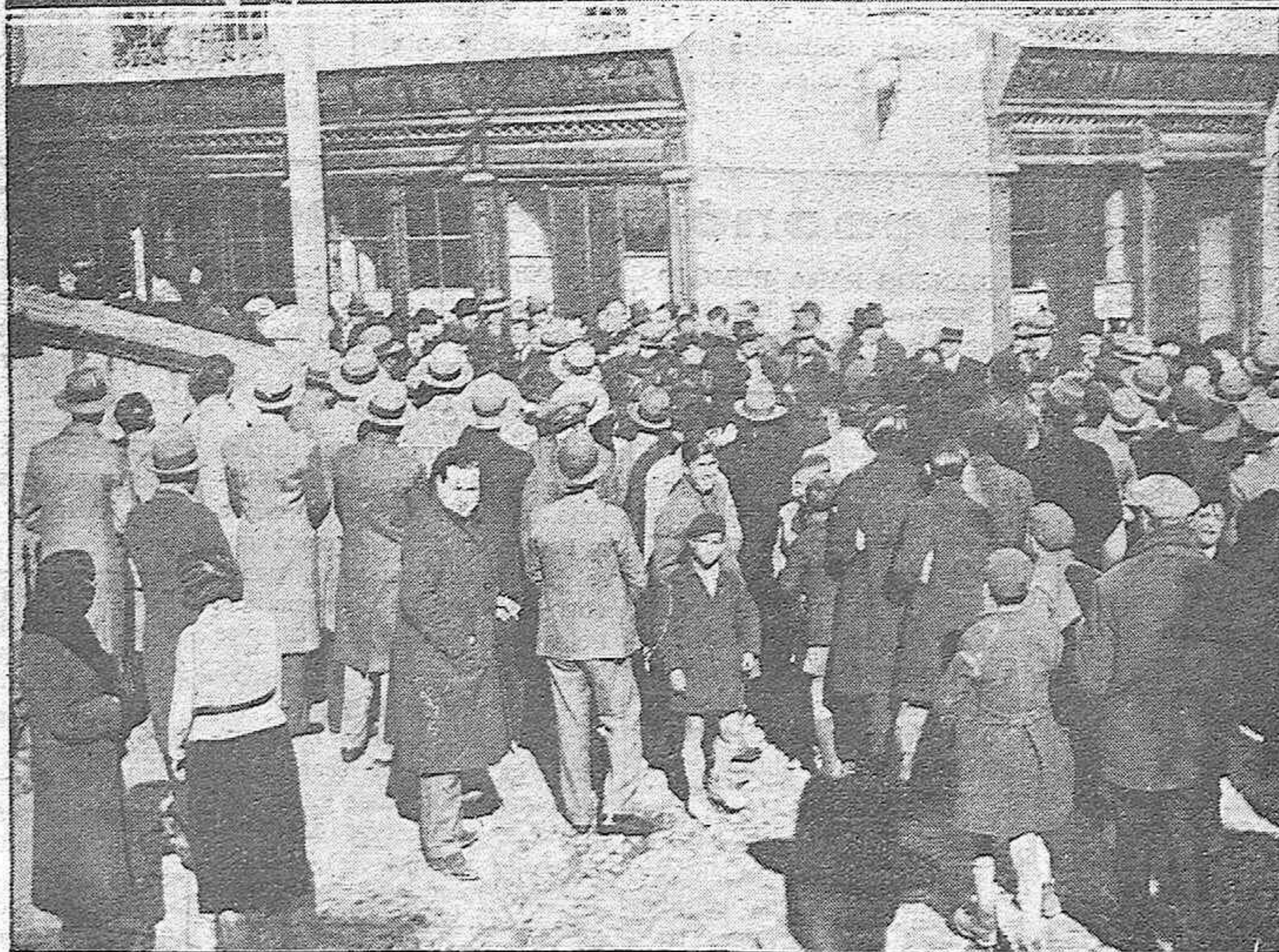
LOS FUNERALES POR LOS GUARDIAS CIVILES MUERTOS EN CASTILBLANCO.—Los jefes del 18.º Tercio, que presidieron el acto.—El público a la salida de la Iglesia de la Compañía.