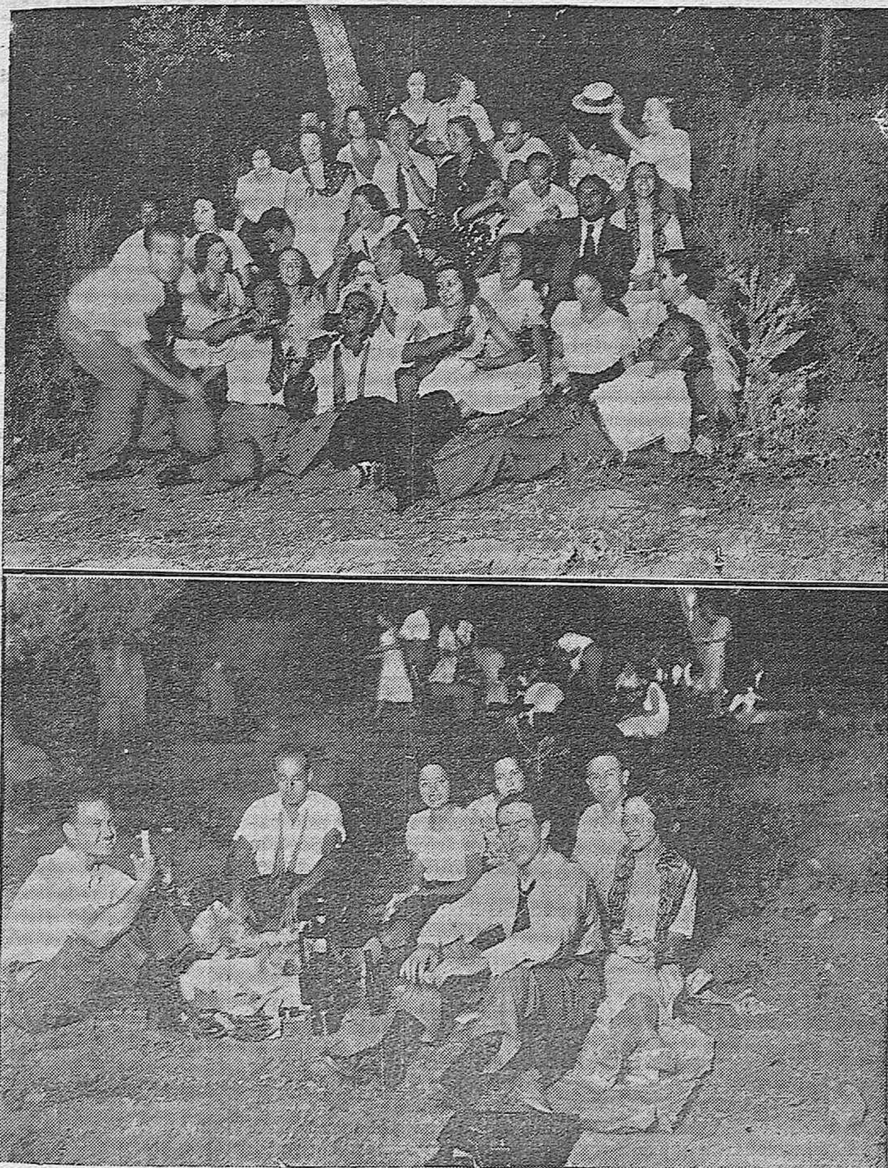
ACTUALIDAD GRAFICA.—Fiesta campera organizada por el Tennis Club de Córdoba en honor de los ganadores del campeonato