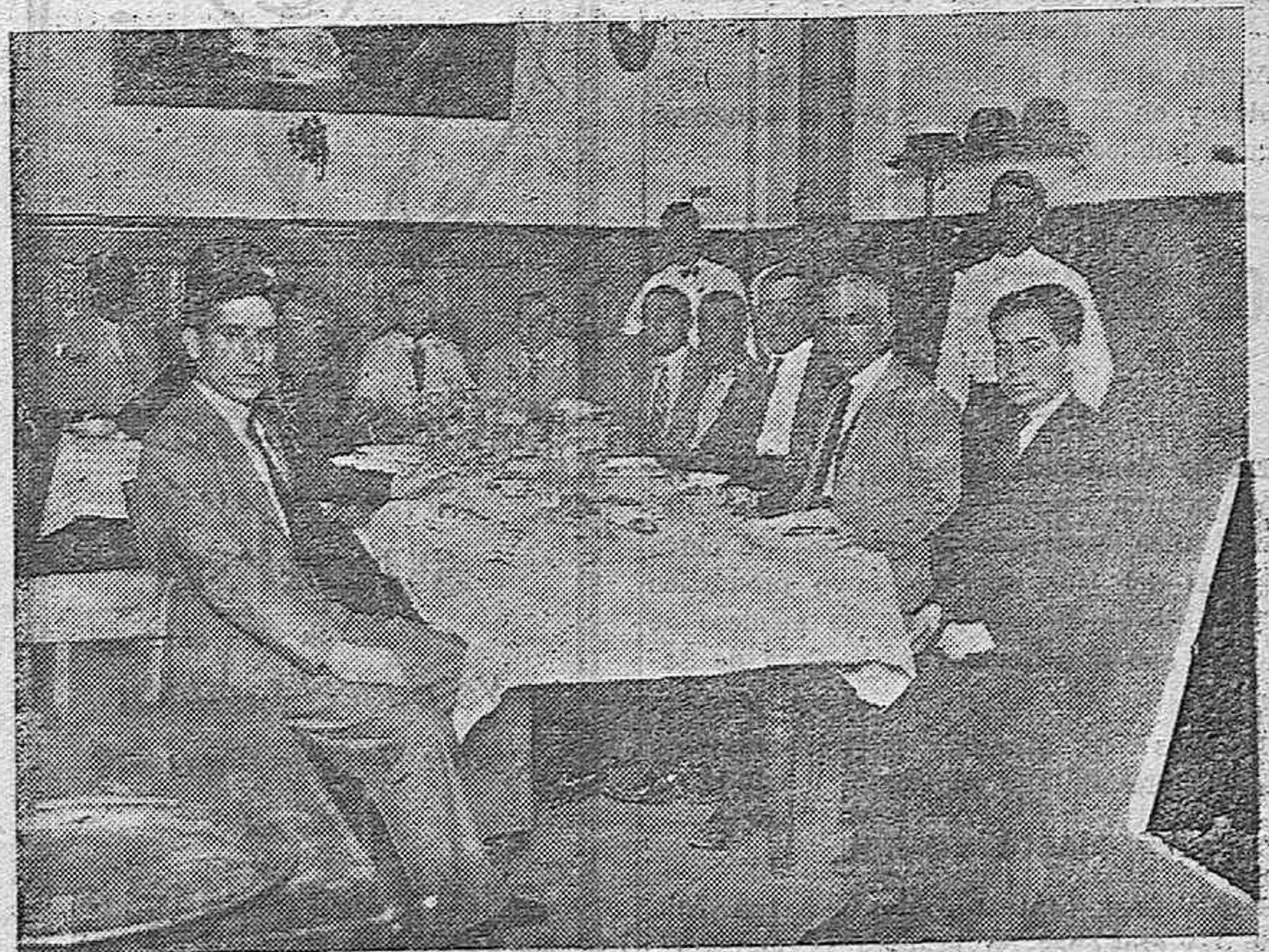
Comida íntima con la cual los miembros de los Jurados Mixtos de la Propiedad Rústica de Córdoba celebraron la toma de posesión de dichos cargos