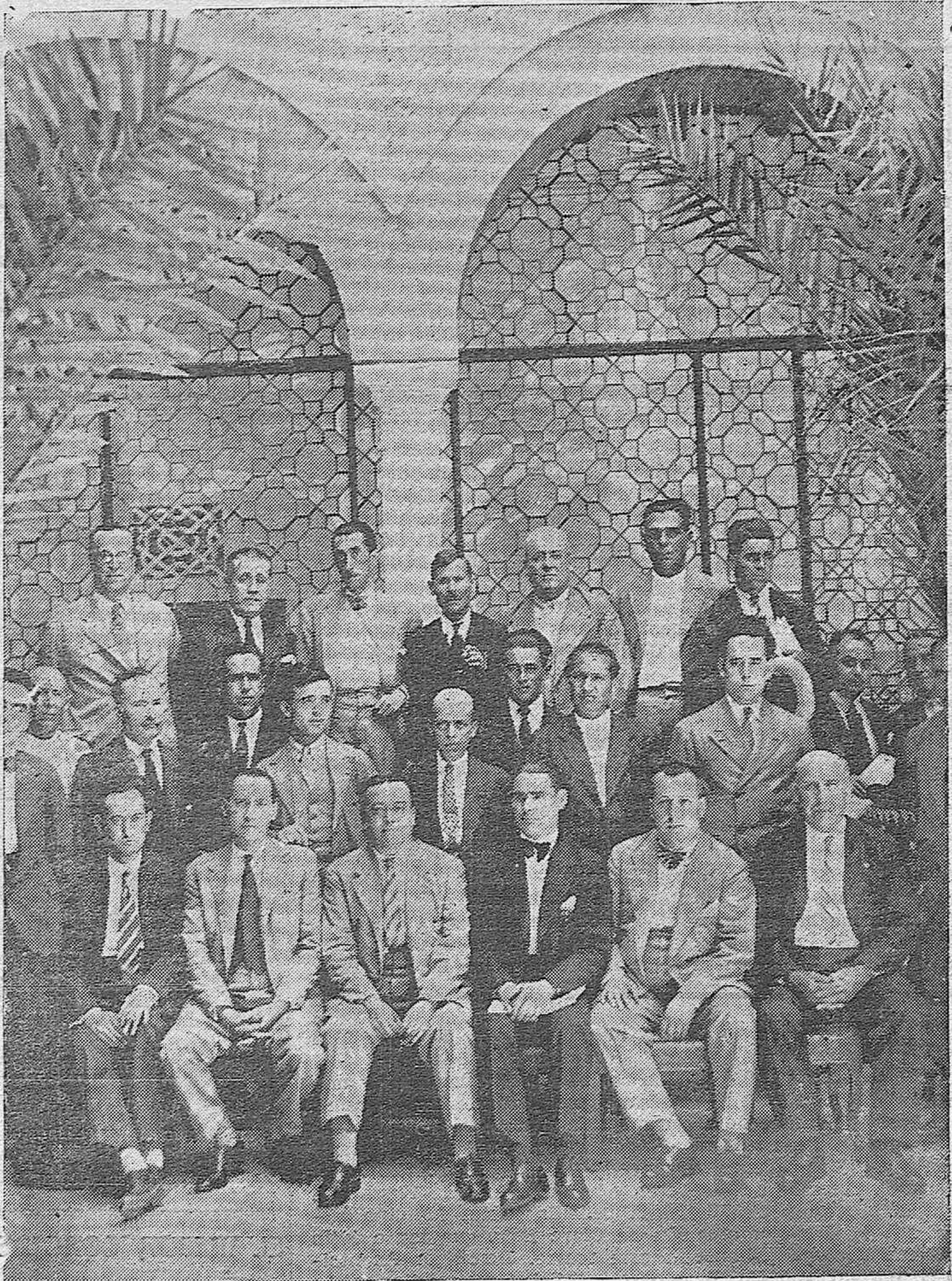
ACTUALIDAD GRAFICA. —Los vocales gestores de la Diputación y alcaldes de la provincia que asistieron a la interesante sesión celebrada ayer encaminada a conseguir la reanudación de los trabajos en los caminos provinciales