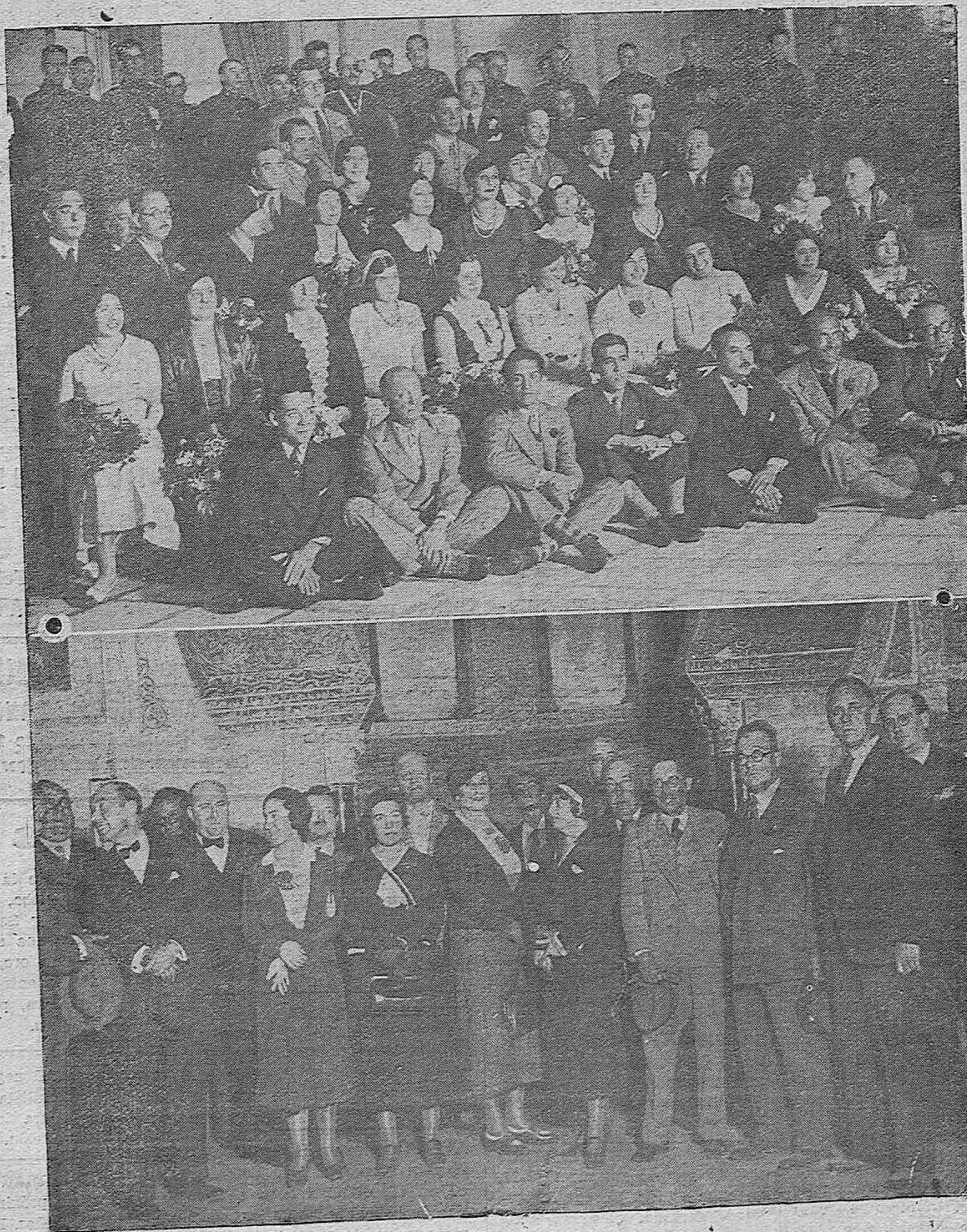
LOS CONGRESISTAS POSTALES PANAMERICANOS.—Grupo de concurrentes al vino de honor, con que fueron obsequiados en el Círculo de la Amistad.— Miembros del Congreso Postal Panamericano celebrado en Madrid, en su visita al Mirhab de la Mezquita.