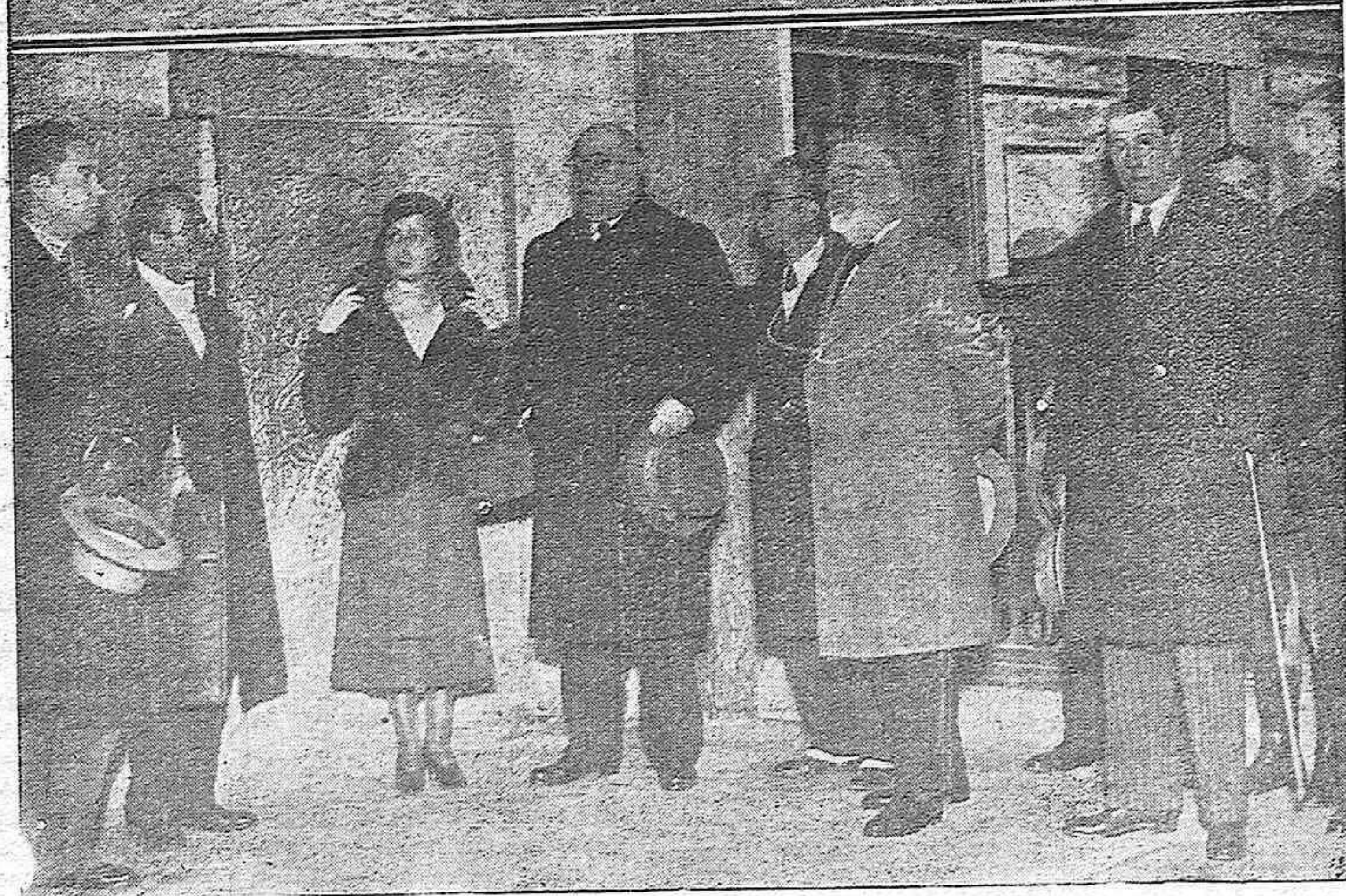
EL JEFE DEL GOBIERNO EN CORDOBA.—El señor Azana acompañado del Gobernador civil a su llegada a La Mezquita.—El Jefe del Gobierno, con su joven y bella esposa y personalidades que lo acompañaron en su visita al Mirhab