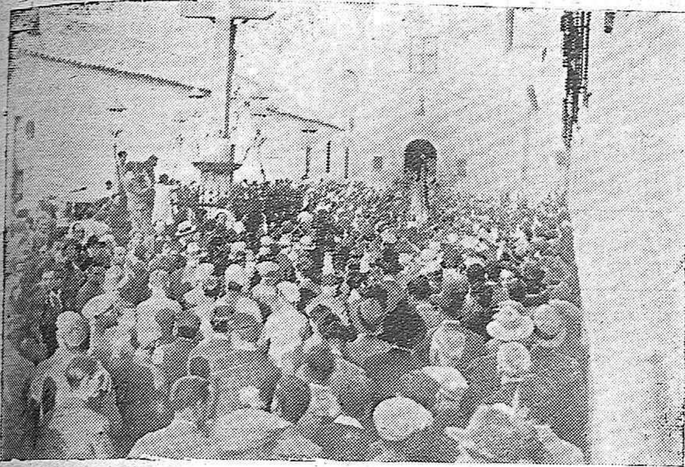
EL ENTIERRO DE JULIO ROMERO DE TORRES.—EL CORTEJO FÚNEBRE AL LLEGAR A LA PLAZA DE LOS DOLORES.