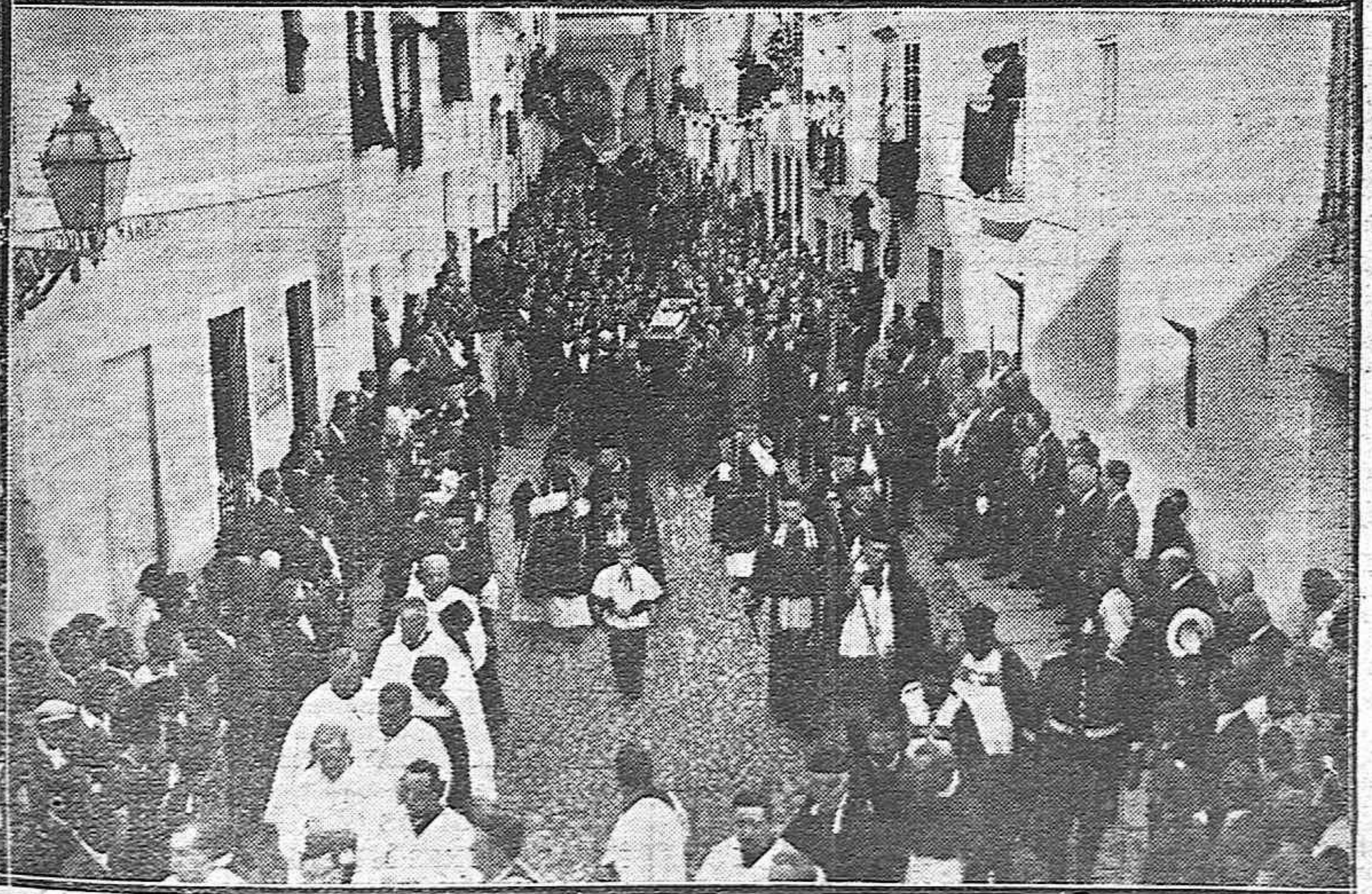
EL ENTIERRO DE JULIO ROMERO DE TORRES.—MOMENTO DE SALIR LA FUNEBRE COMITIVA DEL MUSEO PROVINCIAL.—PASO DEL ENTIERRO POR LA CALLE DE ROMERO BARROS.