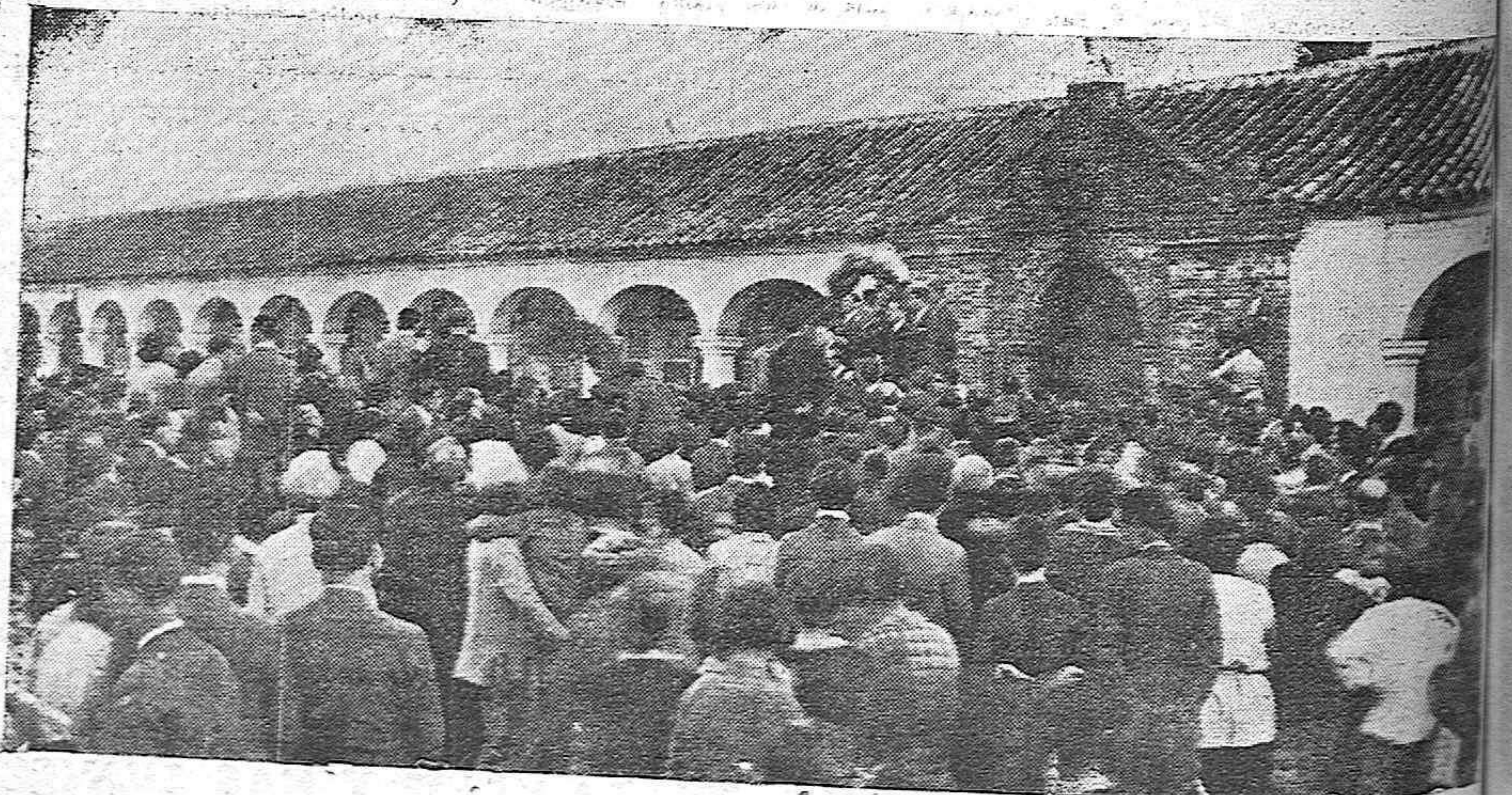
EL ENTIERRO DE JULIO ROMERO DE TORRES. — MOMENTOS DE DAR SEPULTURA AL CADÁVER EN EL CEMENTERIO DE SAN RAFAEL.

GANGA: percales preciosos, desde 7 pesetas metro, y telas para batas, desde 1 pesetas metro, en El Metro y sus Sucursales.