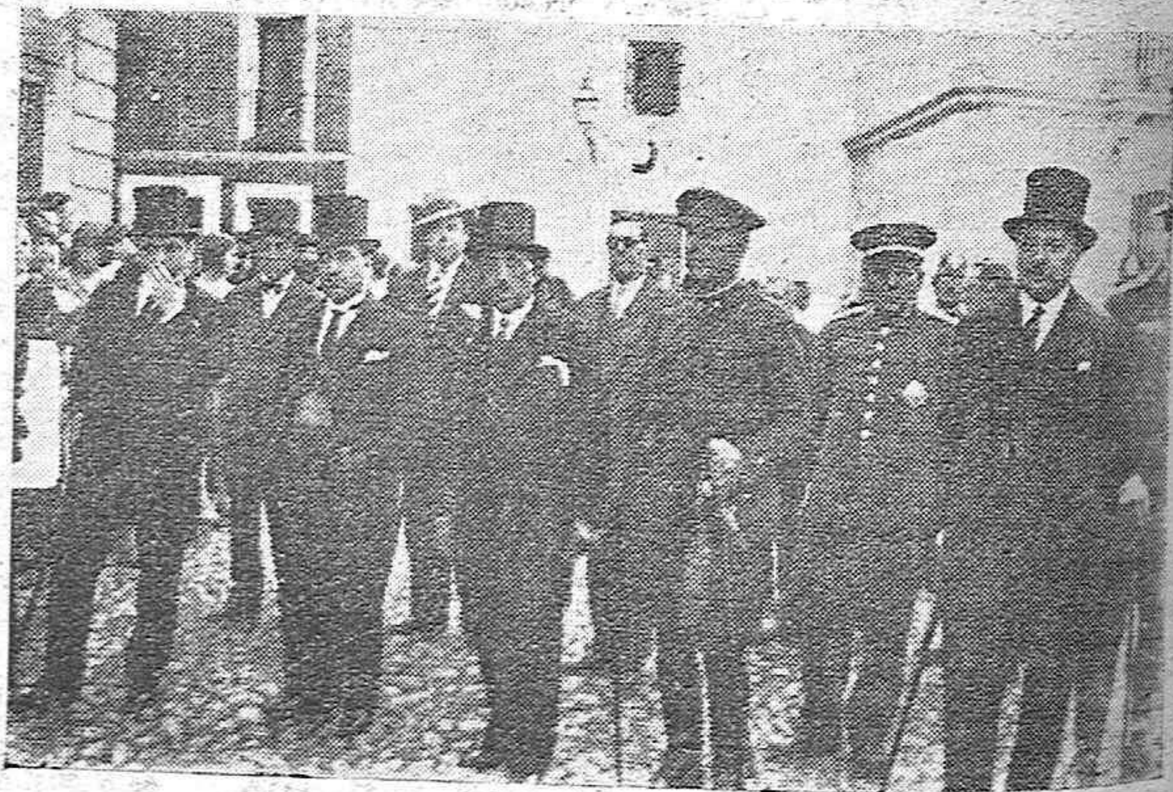
EL ENTIERRO DE JULIO ROMERO DE TORRES.—EL MINISTRO DE JUSTICIA Y CULTO SEÑOR ESTRADA, PRESIDIENDO EL DUELO EN NOMBRE DEL GOBIERNO DE S. M.

ALTO: para medias, calcetines y canisetas verano, la casa más surtida y de precios más afinados, es El Metro y sus Sucursales.