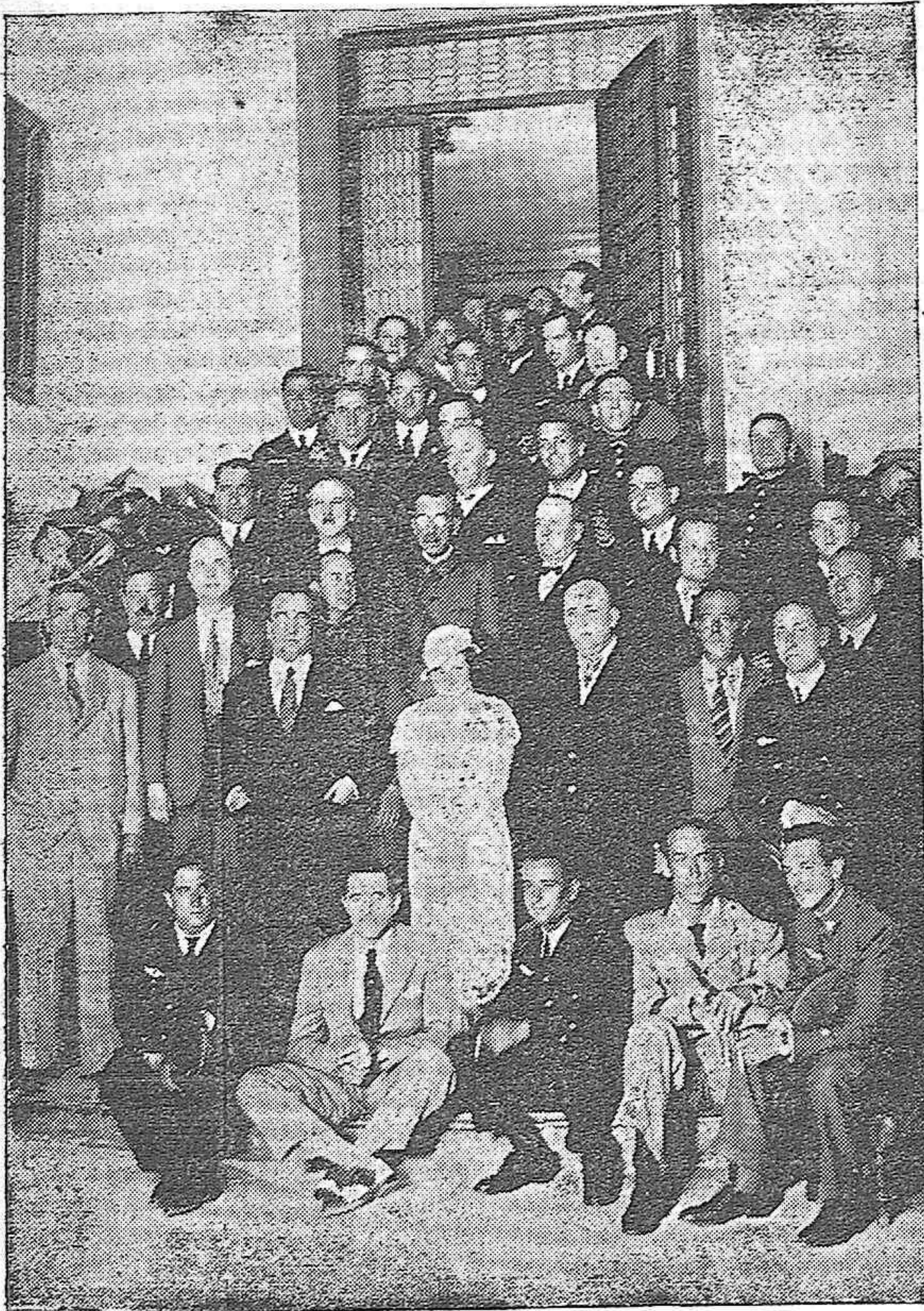
Los pilotos civiles y militares que toman parte en la Fiesta de Aviación, con las autoridades y concejales después de la recepción celebrada en el Ayuntamiento en honor de aquéllos