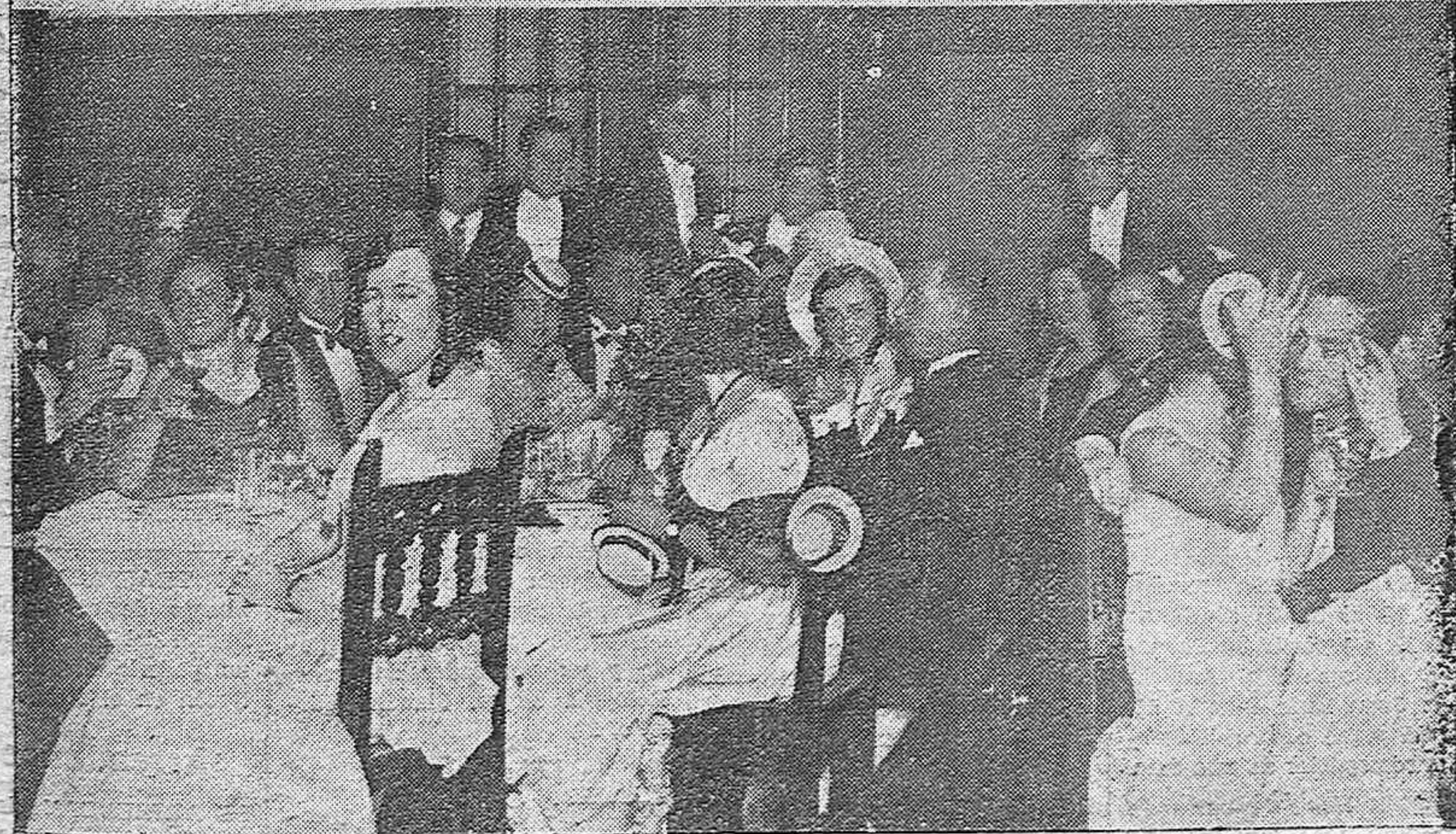
LA CENA CARNAVALESCA DEL TENNIS-CLUB.—Grupo de lindas señoritas que concurrieron caprichosamente disfrazadas.— aspecto del comedor del Regina durante la cena a la americana.