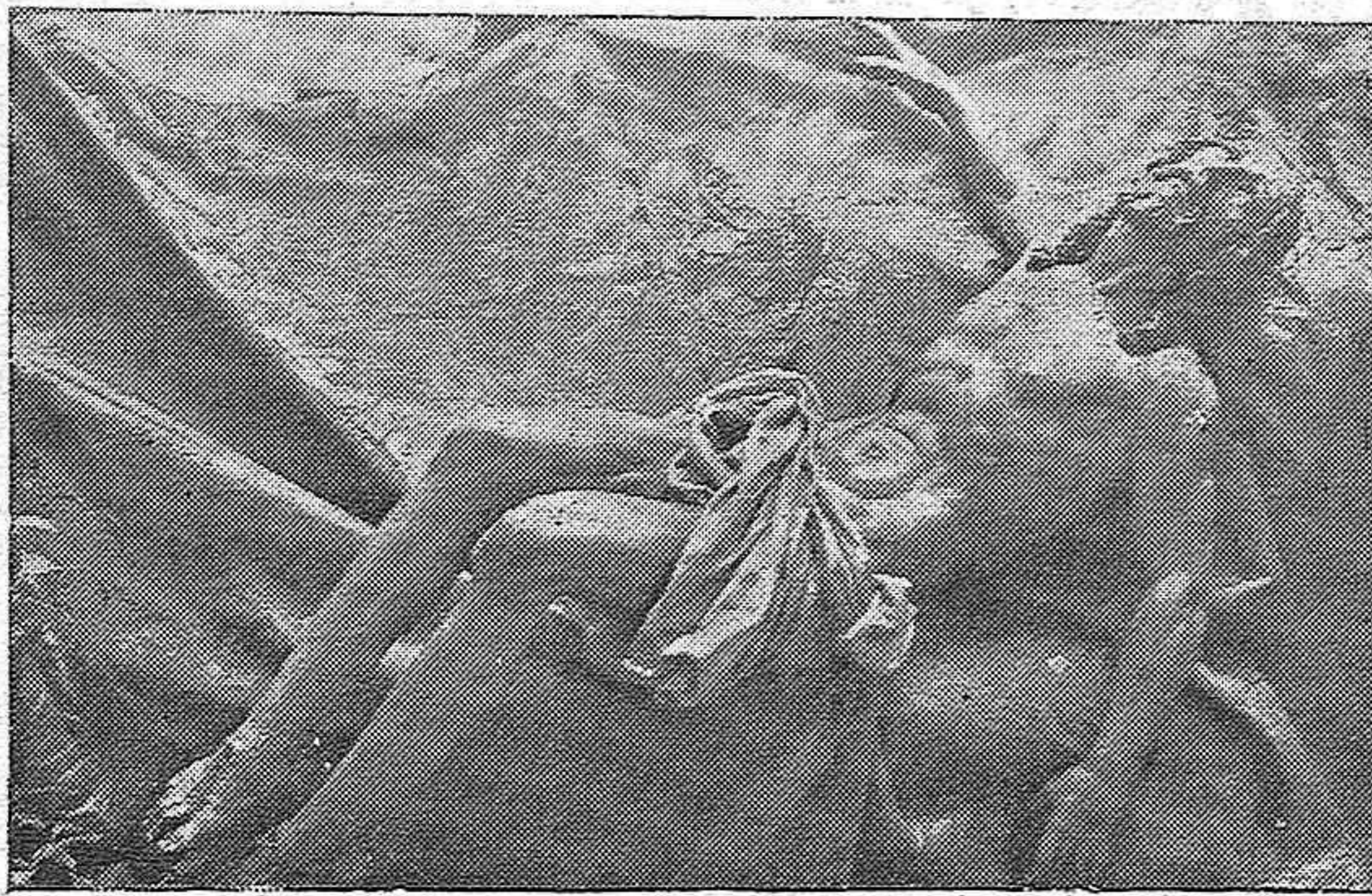
Imagen del Cristo yacente que lleva en sus brazos la Virgen de las Angustias. La escultura es del insigne imaginero Juan de Mesa.

Por la belleza y mérito artístico de la efigie sagrada, por la riqueza de ornamentos, lujo de la Cofradía y majestuosa disposición del desfile ha de constituir el espectáculo del tránsito de esta Cofradía por las calles de la Ciudad uno de los más atractivos festejos religiosos de esta Semana Santa, aunque son muchas las Cofradías—ya lo iremos viendo en sucesivas informaciones—que se han preparado para competir con ella en un estímulo propicio al engrandecimiento de estas fiestas religiosas y tradicionales.