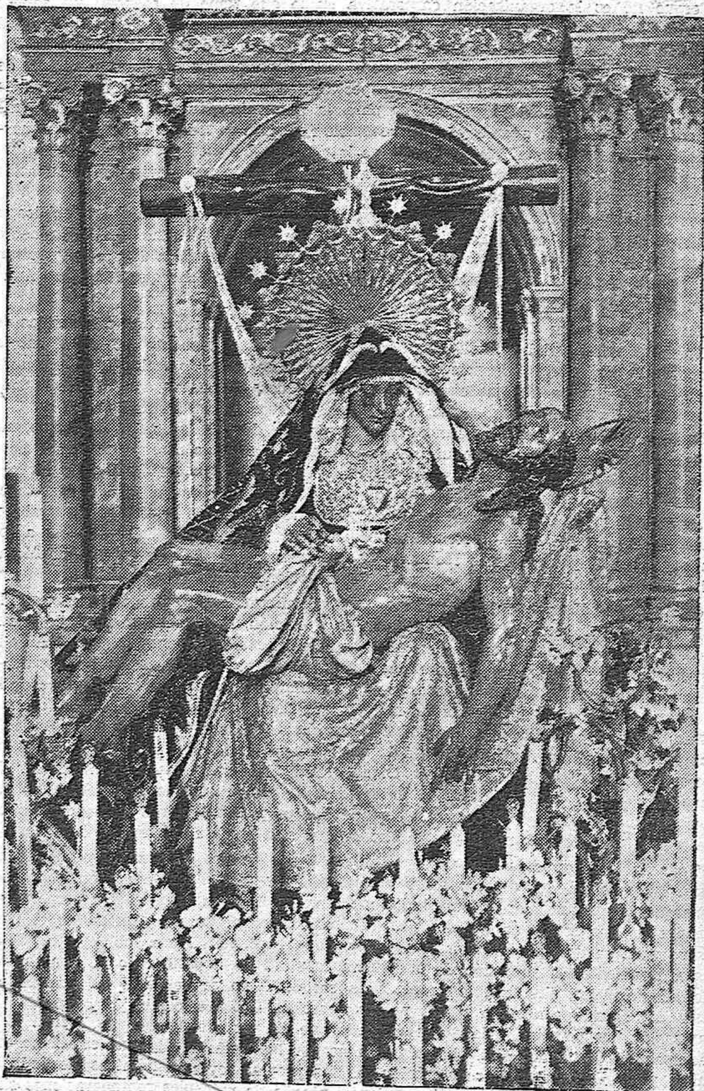
Hermosísima Imagen de Nuestra Señora de las Angustias, atribuida al imaginero Juan de Mesa, la que con su cofradía desfilará el Jueves Santo por las calles de la capital.

Las gualdrapas de las andas, de terciopelo, llevan bordado en el frente el escudo de Córdoba.