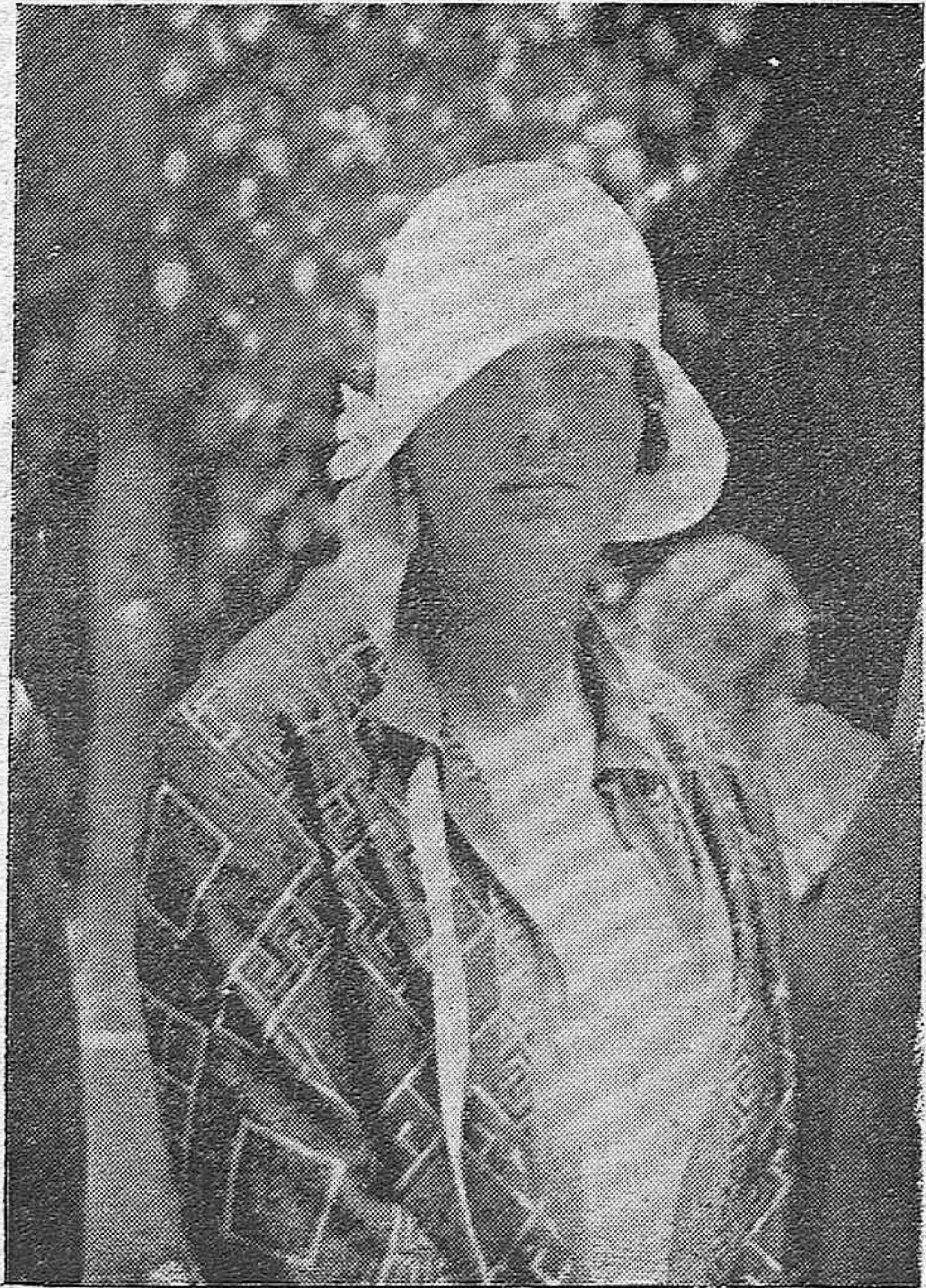
LA PRINCESA ILEANA DE RUMANIA, AQUELLA LINDA PRINCESA DE ROMANJE QUE ESTUVO, NO HACE MUCHO, ENTRE NOSOTROS, Y CUYA BODA CON EL PRÍNCIPE ALEJANDRO HOCHBERG—UNA BODA DE AMOR, EN QUE LA RAZÓN DEL GOBAYÓN PUDO MÁS QUE LA RAZÓN DE ESTADO—SE ANUNCIA PARA MUY EN BREVE.