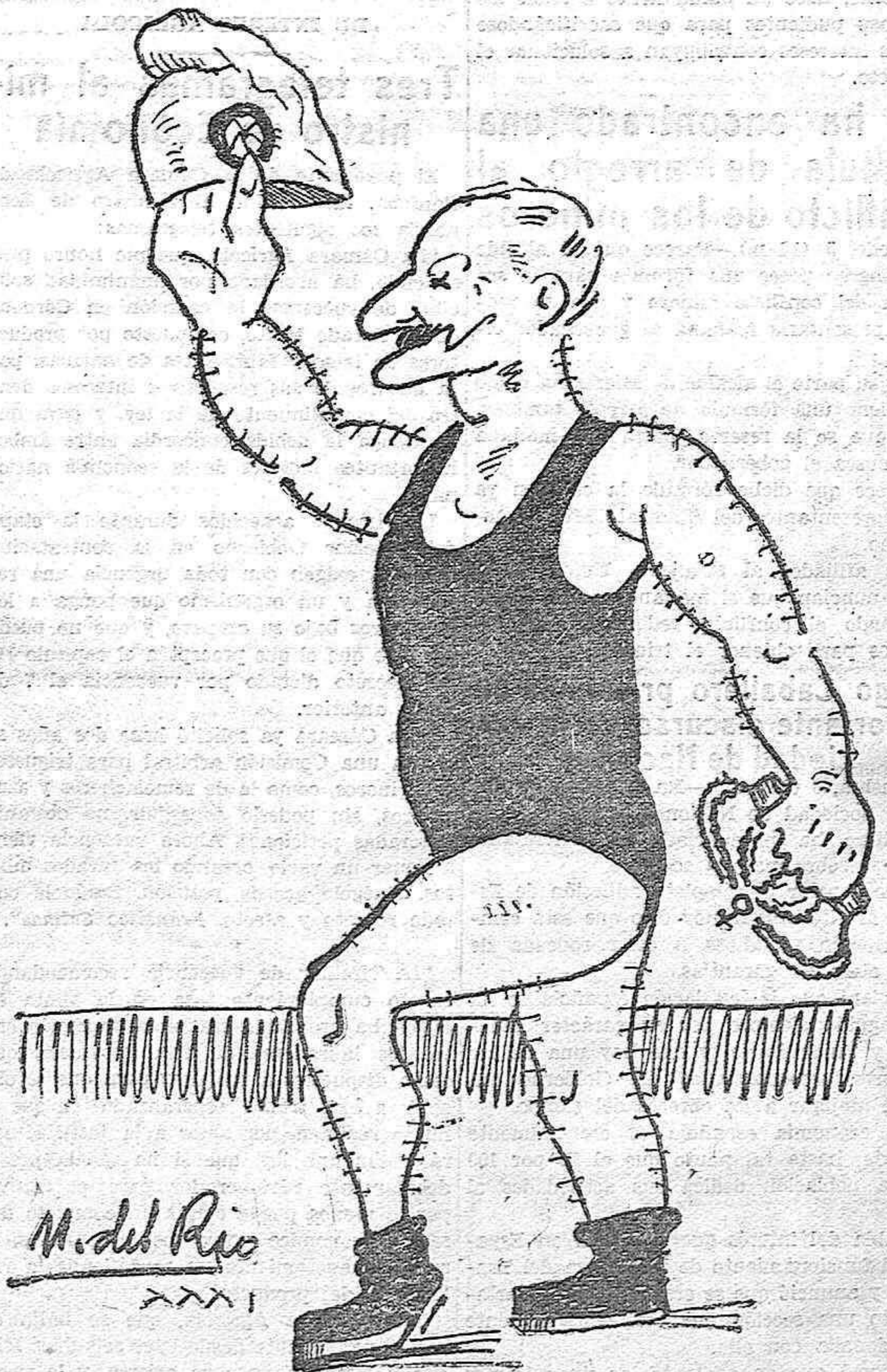
—Con este sencillito escamoteo, no puedo perder mi fama de prestigitador. ¿Pero... habrá quien me crea?