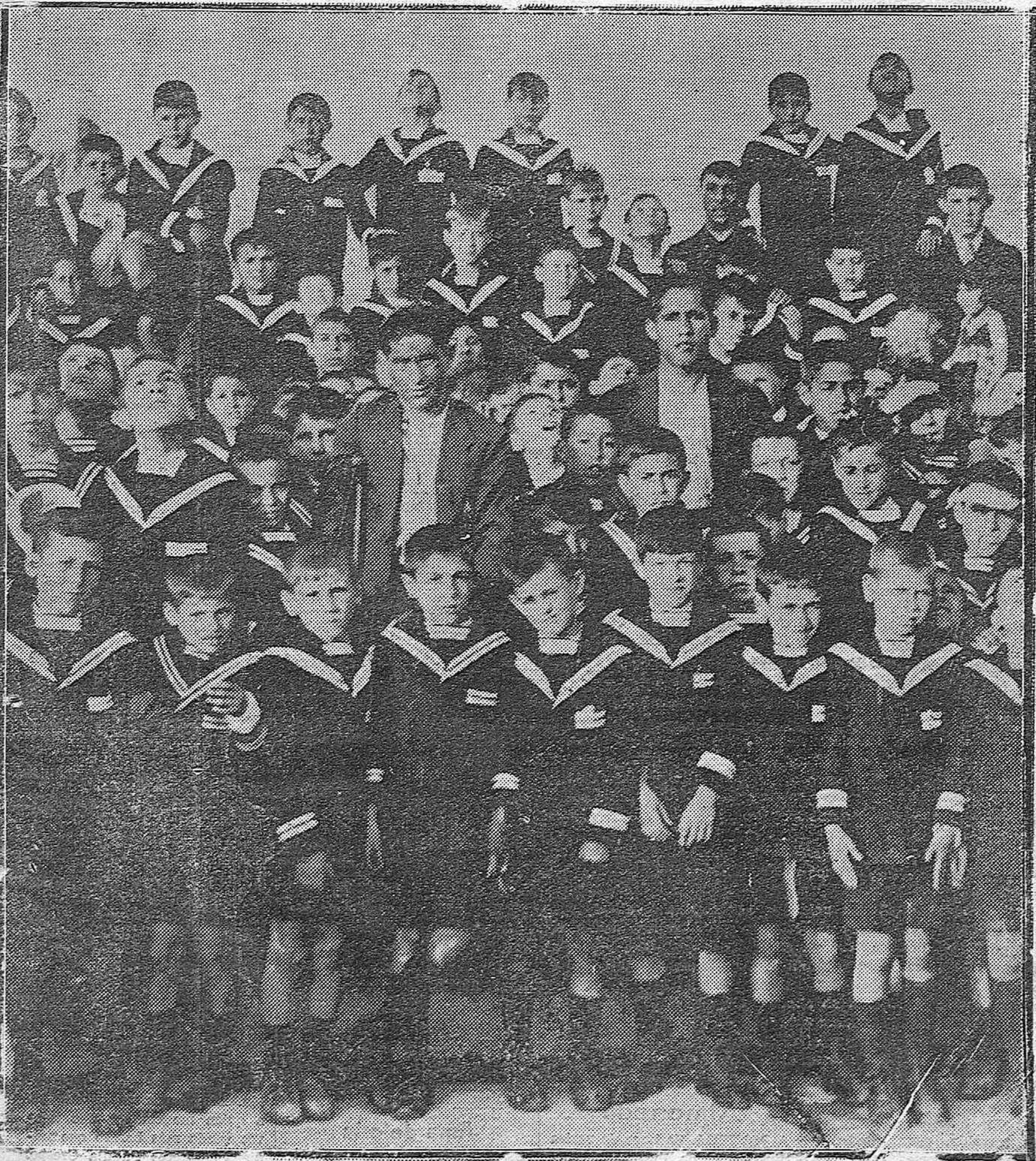
LOS NIÑOS DEL HOSPICIO QUE DURANTE LOS FESTEJOS FUNDARON POR LA FERIA