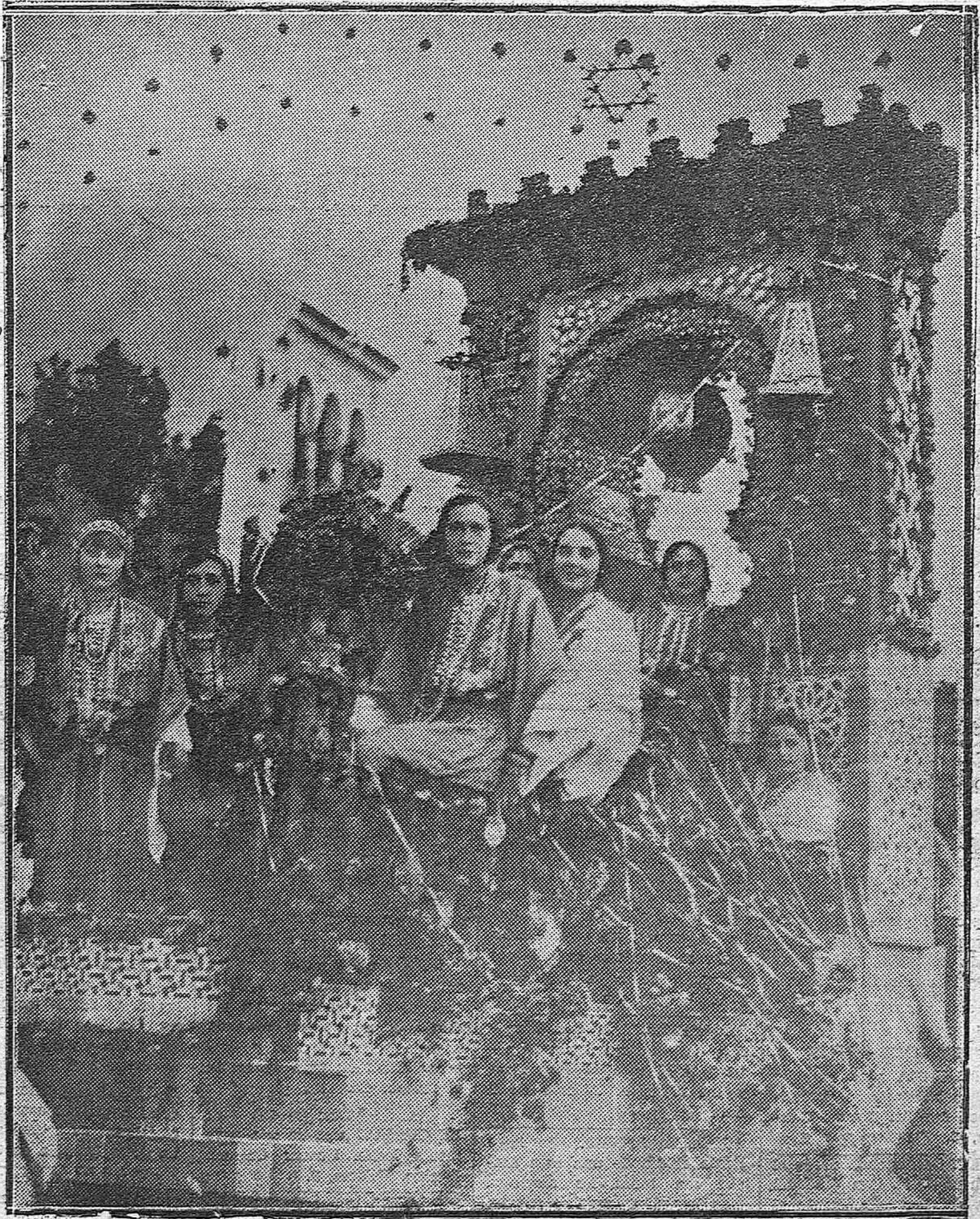
LA BATALLA DE FLORES.—La carroza titulada "Jardín del Califato", del gremio de legiños que obtuvo el segundo premio.