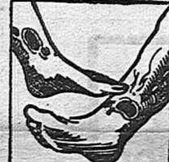
Males en las piernas

La sangre del artrítico está entorpecida por venenos que provienen de una insuficiencia de vitalidad y por consiguiente, su circulación es del todo defectuosa. Las piernas del enfermo están hinchadas y entorpecidas con varices dolorosas con peligro de ruptura o de ulceración interminable. Con frecuencia el artrítico está atormentado con dolores gotosos o reumáticos que le hacen a veces con el tiempo le agotan. Sus riñones están generalmente obstruidos con neutrítis, albuminuria, arena en la orina (mal de piedra) y a veces fuertes dolores en la espalda. Las arterias duras y quebradizas como tubos de pipa (arteriosclerosis) amenazan a cada instante, accidente generalmente pronosticado con insomnios y dolores de cabeza. La mujer artrítica tiene épocas irregulares o penosas y su edad crítica es un largo suplicio, con bocanadas de calor, vértigos, jaquecas, postración profunda, con frecuencia fibromas o tumores en el vientre. Los artríticos de ambos sexos tienen también enfermedades de la piel, acné, eczemas, herpes, sarpullidos, prurigo, soriasis, foronculos, etc., con lesiones molestas y comezones intolerables. Todos esos enfermos de la sangre, todas esas víctimas mártires del artrítico no tienen que desesperarse y creerse incurables pues el