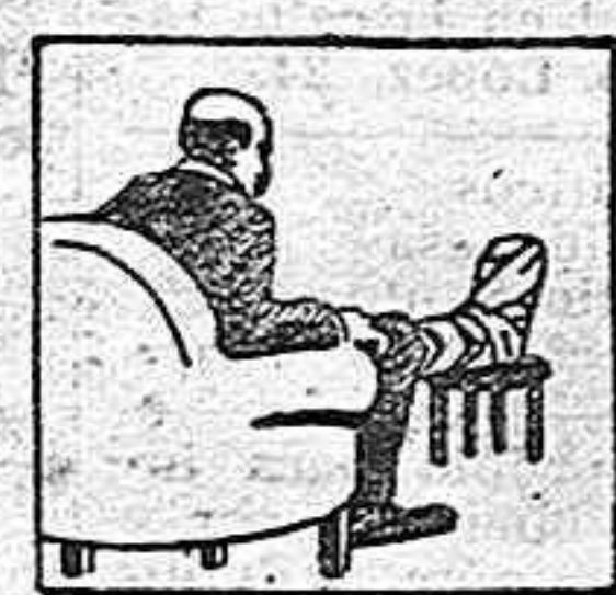
Gota - Dolores