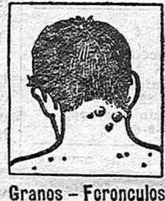
Granos - Foronculos