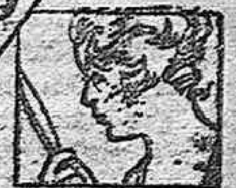
Ezomas - Herpes Granos - Rojacos