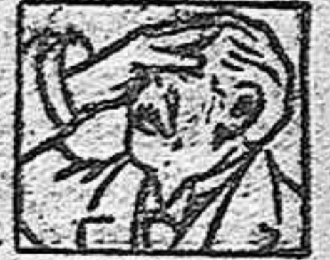
Jaquecas - Neuralgias - Vértigos - - Congestiones -