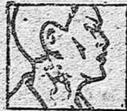
Paparas - Sangliones Masas - Forunculos