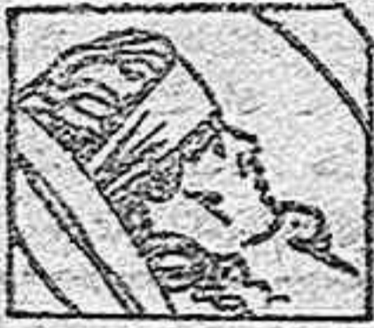
Malestares periodicos Accidentes femeninos

El Depurativo Richelet se vende en todas las farmacias. Para detalles escribir al Laboratorio Richelet San Sebastian.