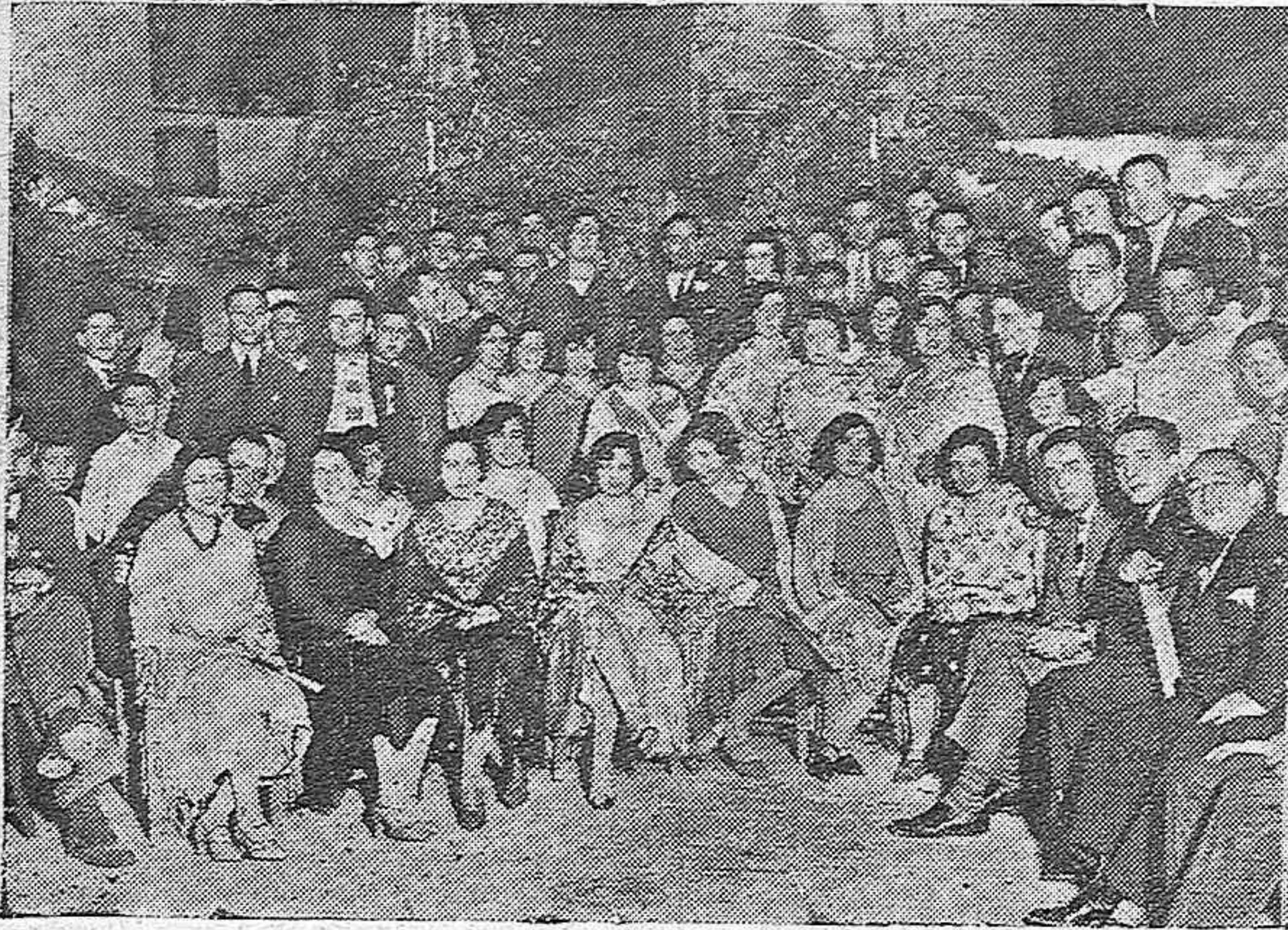
PRIEGO DE CÓRDOBA.—GRUPO DE BELLISIMAS SEÑORITAS Y DISTINGUIDOS JÓVENES QUE ASISTIERON A LA VERBENA DE LA VIRGEN DE BELÉN