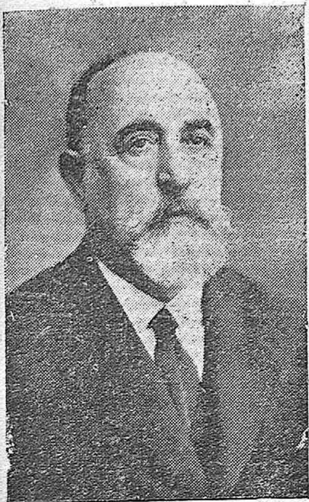
NUESTRO ILUSTRE COLABORADOR DON SEVERINO AZNAR, A QUIEN EL GOBIERNO A CONCEDIDO LA MEDALLA DEL TRABAJO

El beodo fué detenido e ingresado en el depósito municipal a disposición del juzgado.