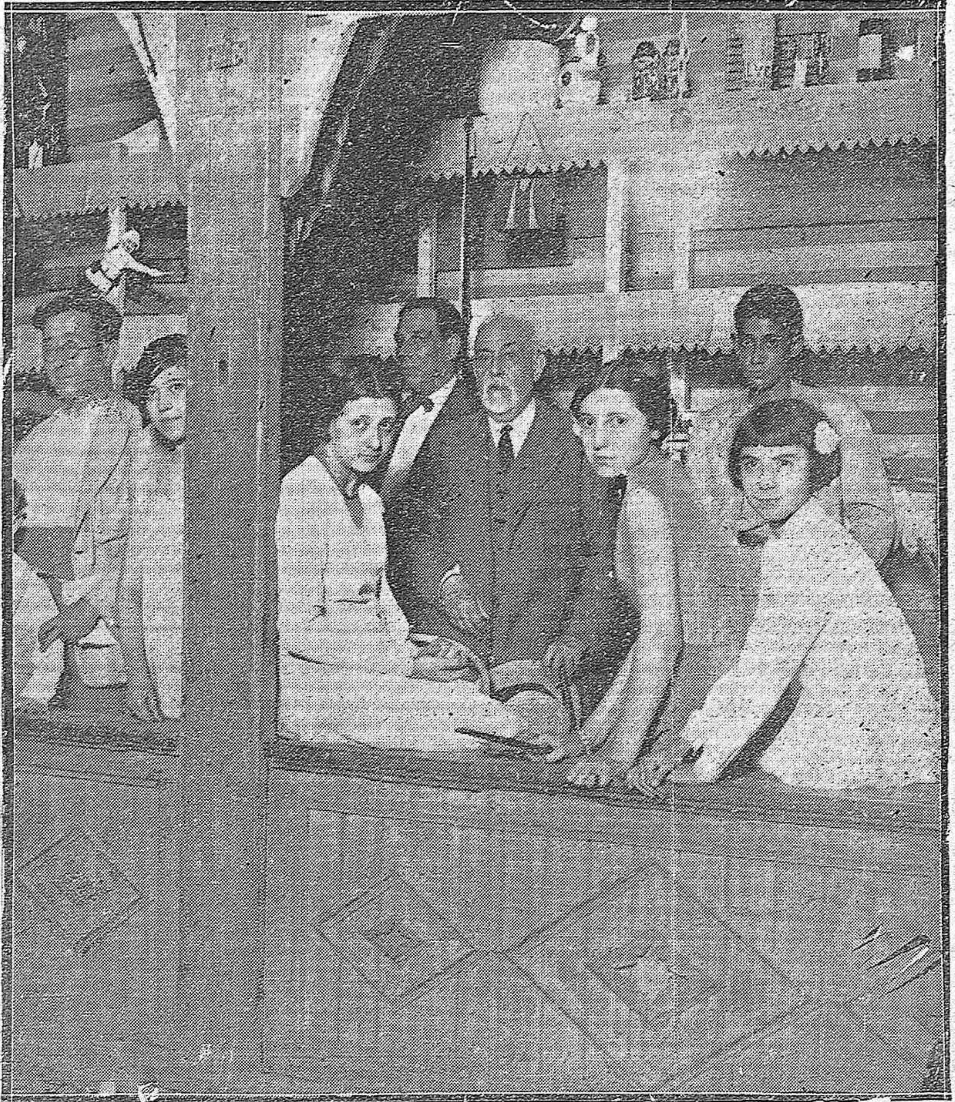
VERBENA DE LA VIRGEN DE LOS FAROLES. — ÚLTIMO DÍA DE LA TÓMBOLA SERVIDA POR SIMPÁTICAS MUCHACHAS EN LA PLAZA DEL TRIUNFO