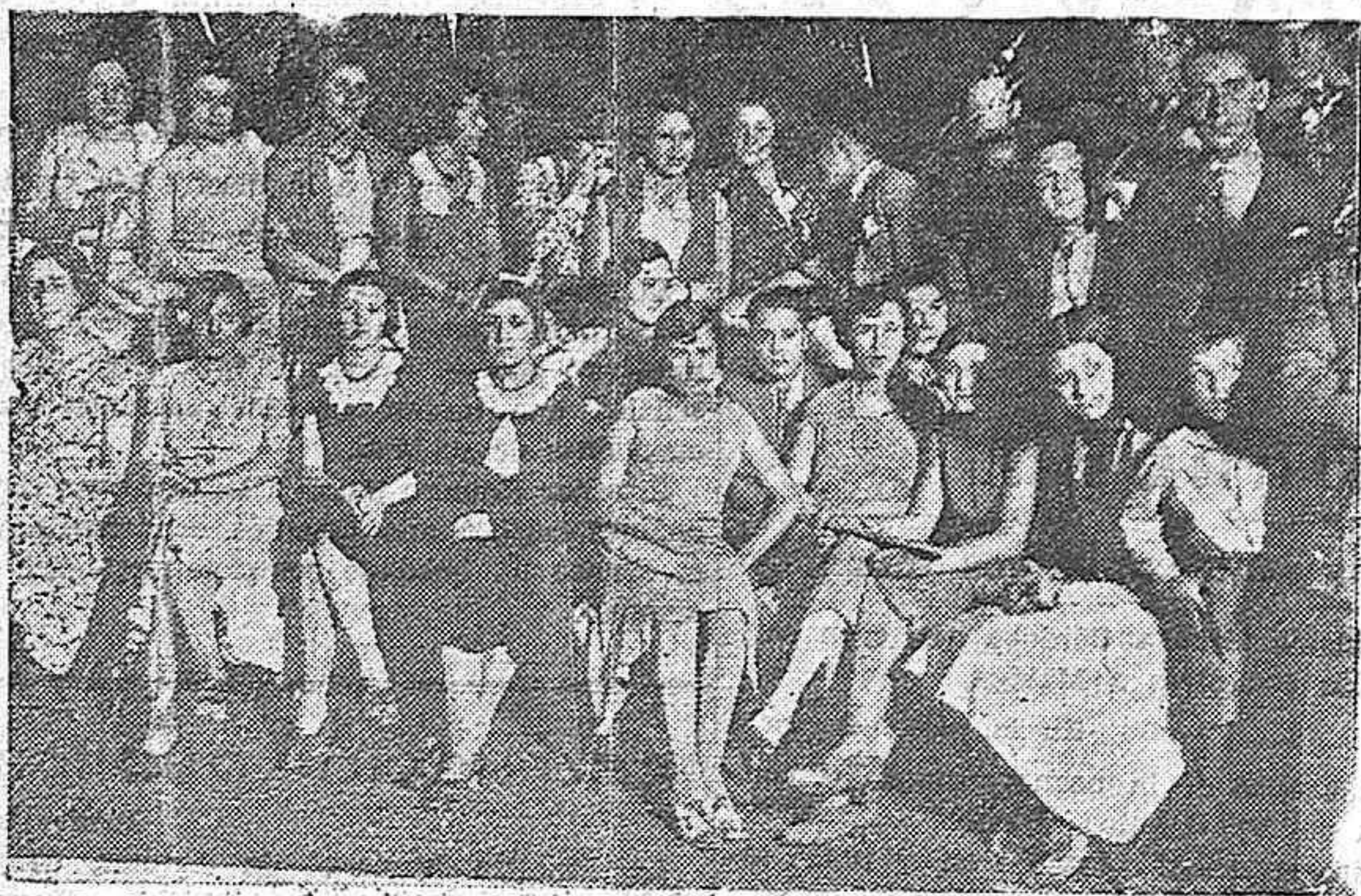
LA VELADA DE LA VIRGEN DE LOS FAROLES.—UN GRUPO DE BELLISIMAS SEÑORITAS QUE HAN ASISTIDO A LA TRADICIONAL VELADA EN LOS ACREDORES DE LA CATEDRAL