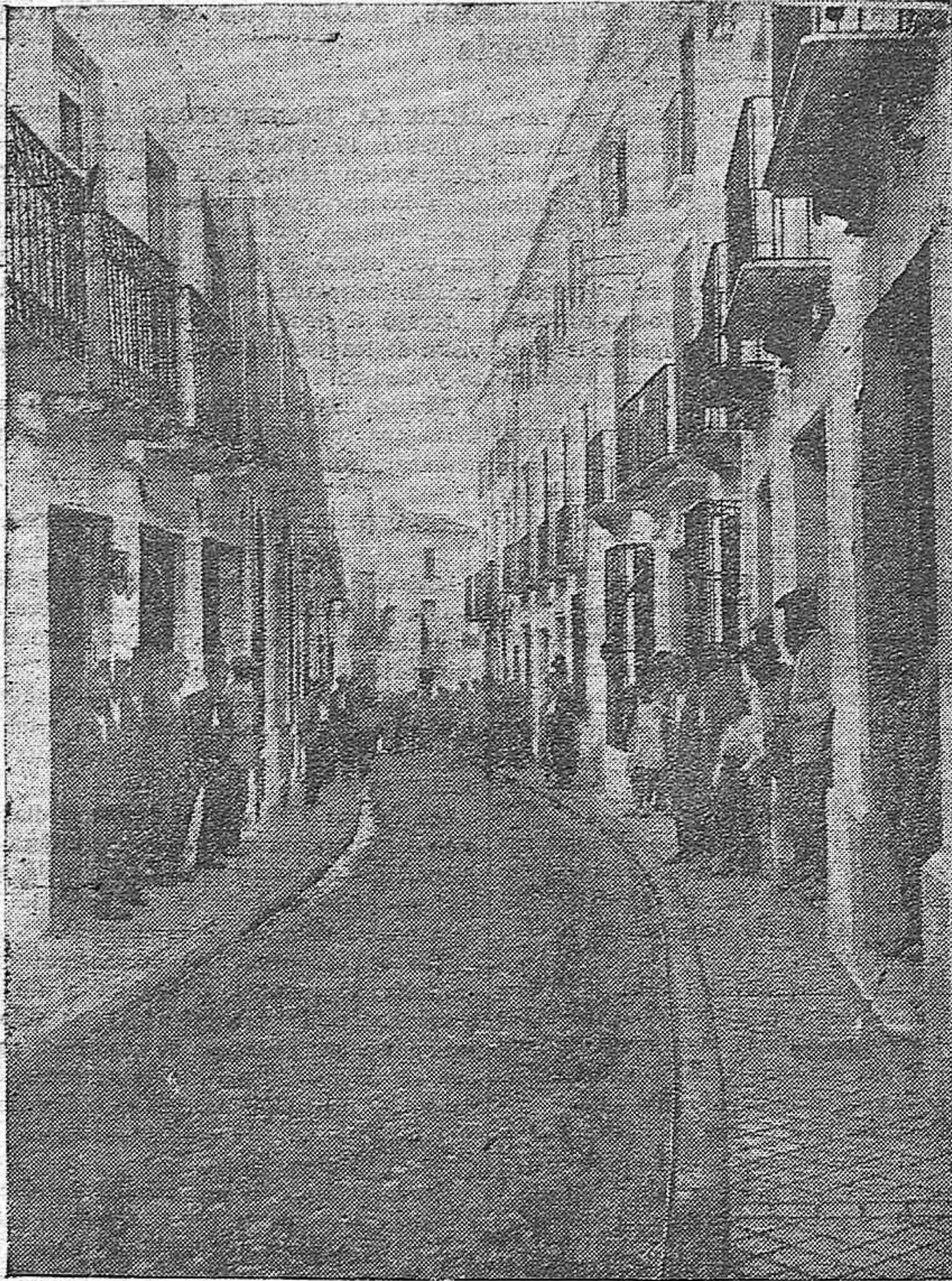
PRIEGO DE CORDOBA.—LA CALLE SOLANA, PAVIMENTADA POR EL AYUNTAMIENTO DE LA DICTADURA