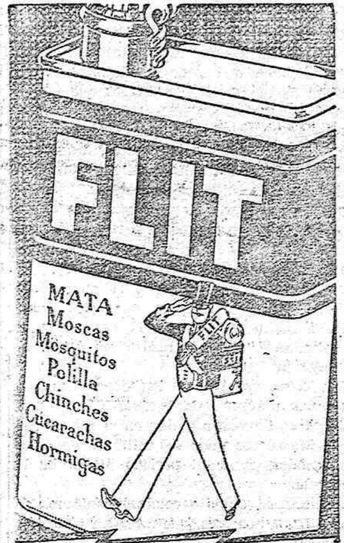
Flit mata más rápido. Bidón amarillo - franja negra.

lámparas, receptores, amplificadores Cruz Conde, 4 CORDOBA