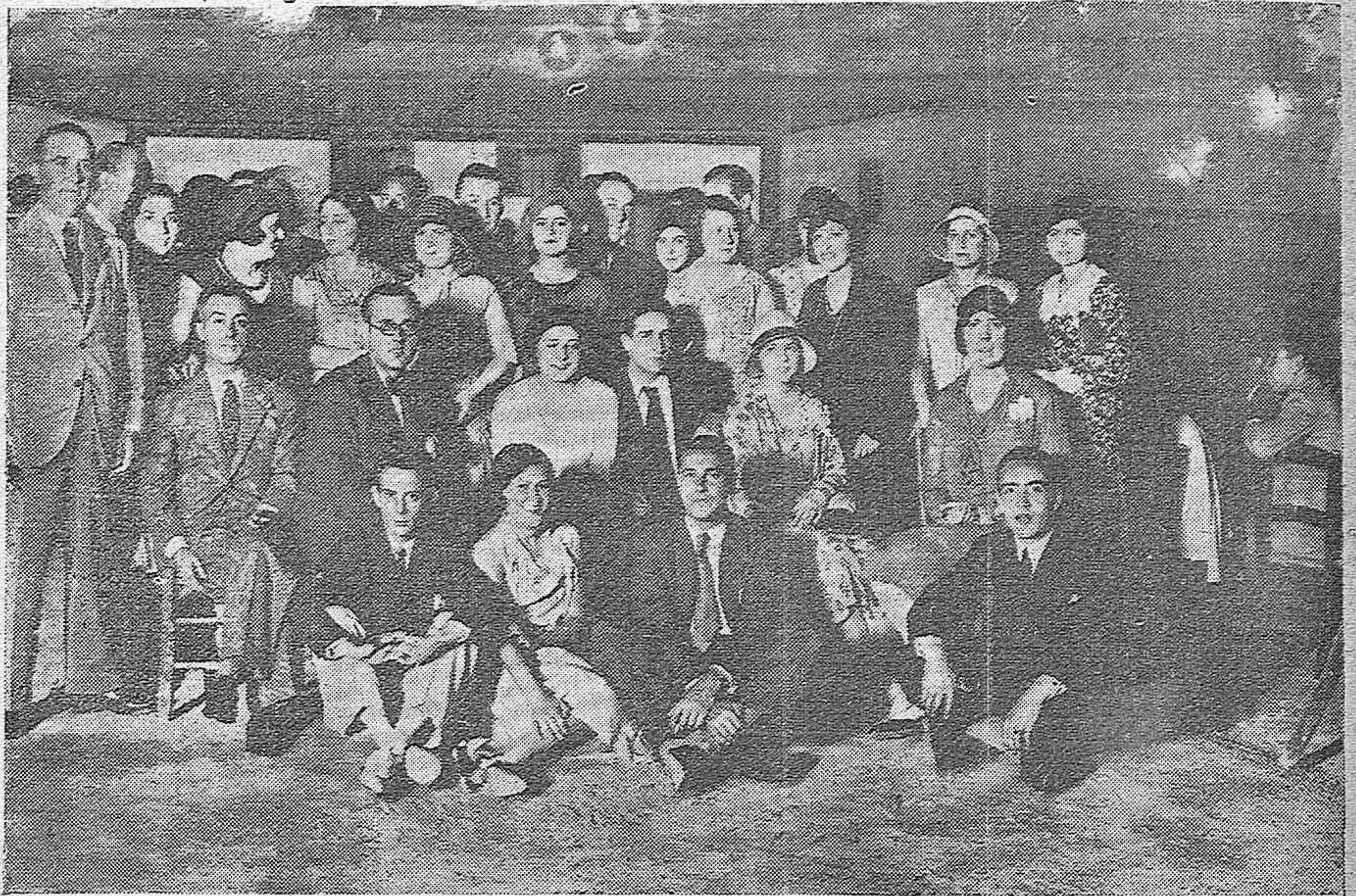
EN EL CAMPO DE TENNIS.—GRUPO DE ASISTENTES A LA VERBENA CELEBRADA CON MOTIVO DE LA ENTREGA DE COPAS.