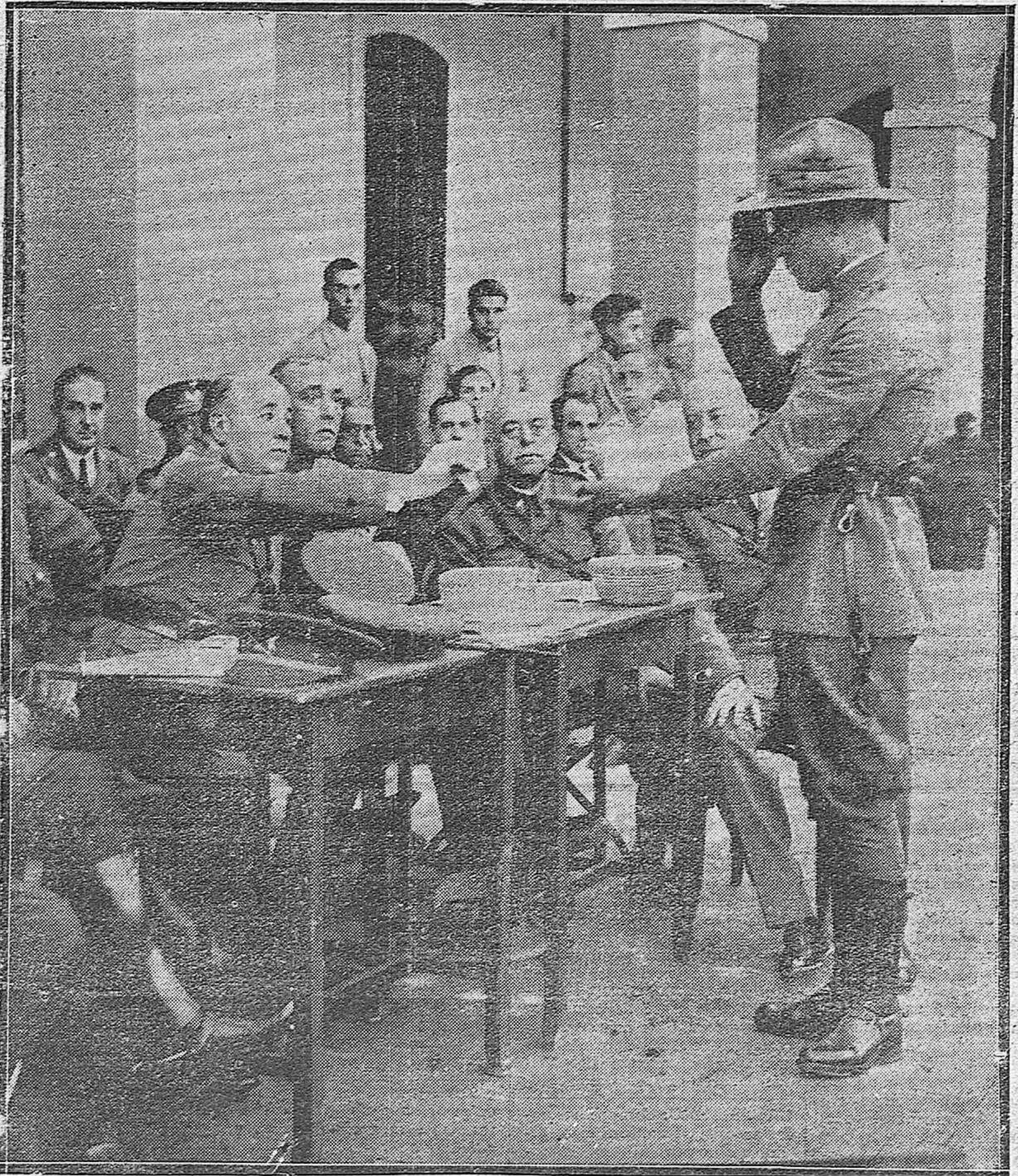
EN EL CUARTEL DE SAGUNTO.—EL CORONEL SEÑOR BURRIEL, CON LOS JEFES DEL REGIMIENTO ENTREGANDO LOS PREMIOS DE LOS DIVERSOS CONCURSOS ORGANIZADOS CON MOTIVO DE LA FIESTA DE SANTIAGO.