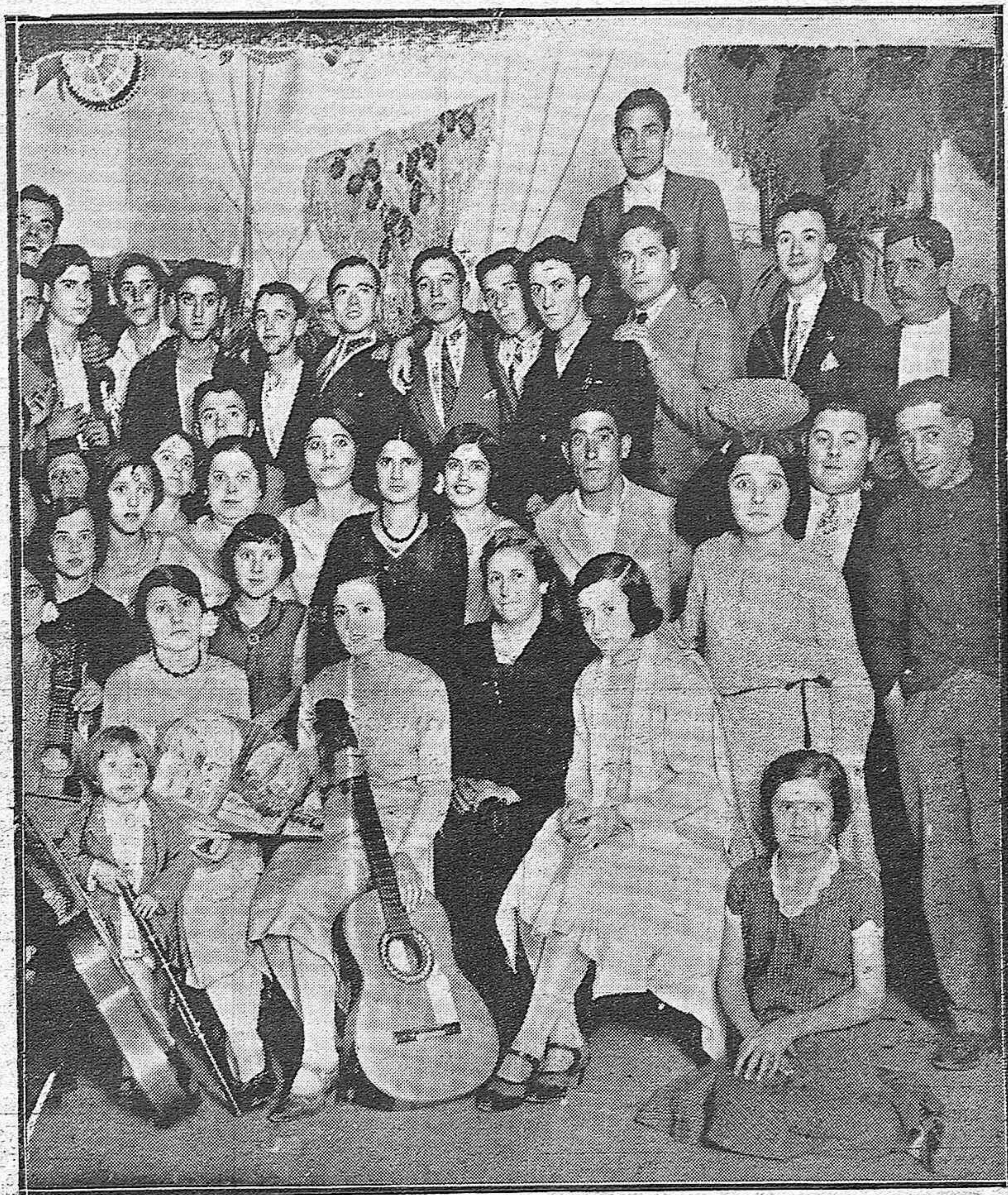
VERBENA CELEBRADA CON MOTIVO DE INAUGURARSE EL NUEVO DOMICILIO DE LA SIMPÁTICA SOCIEDAD DEPORTIVA ATHLETIC-CLUB.