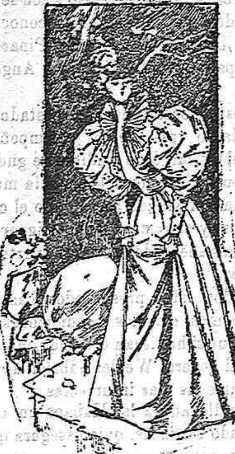
Traje para paseo.

Cuerpo entablado con aldetas acampanadas de seda glase moaré; delantero abierto encima de un plástón de terciopelo miróir; solapas de fay diferente color, bordadas; alrededor del cuerpo (en la cintura) lleva una pata con dos elegantes botones fantasía. Cuello alto con una bonita corbata de muselina de seda y en el borde una puntilla novedad; mangas último modelo, de una pieza, formando bollo, y en la bocamanga dos volantes de muselina de seda. Falda de pañete damas, forma campana, con vivos en las costuras y con biés en el bajo.