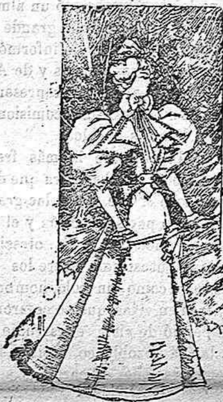
Traje para visita.

Modelos exclusivos para nuestras lectoras, de los grandes almacenes de «El Siglo», Barcelona. (1)