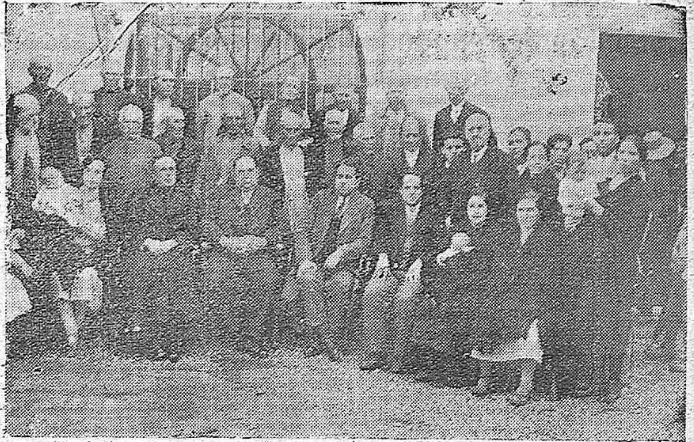
EL RETIRO OBRERO DEL SUBSIDIO MATERNAL EN FERNAN NUÑEZ.—Acto de entregar a las obreras afiliadas el importe de la cancelación de sus libretas.

De ambas sustracciones se ha dado cuenta a la Comisaría de Vigilancia.