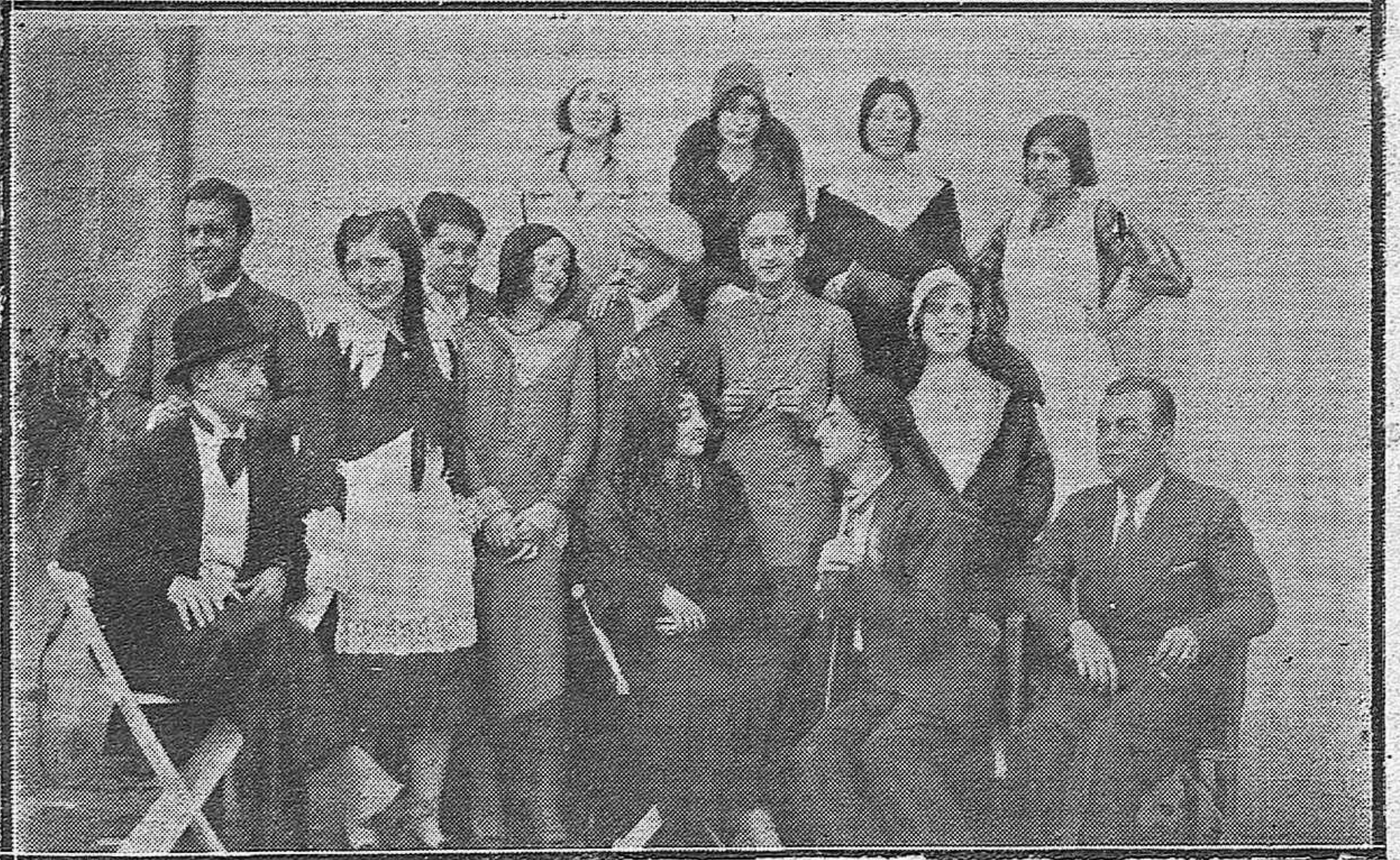
FUNCION BENEFICA EN PORCUNA. —Distinguidos jóvenes de la buena sociedad de este pueblo que interpretaron el coro de "Los románticos", en función a beneficio de los pobres.—Grupo de bellas muchachas y distinguidos jóvenes que pusieron en escena "Pípiola", en la citada función benéfica.