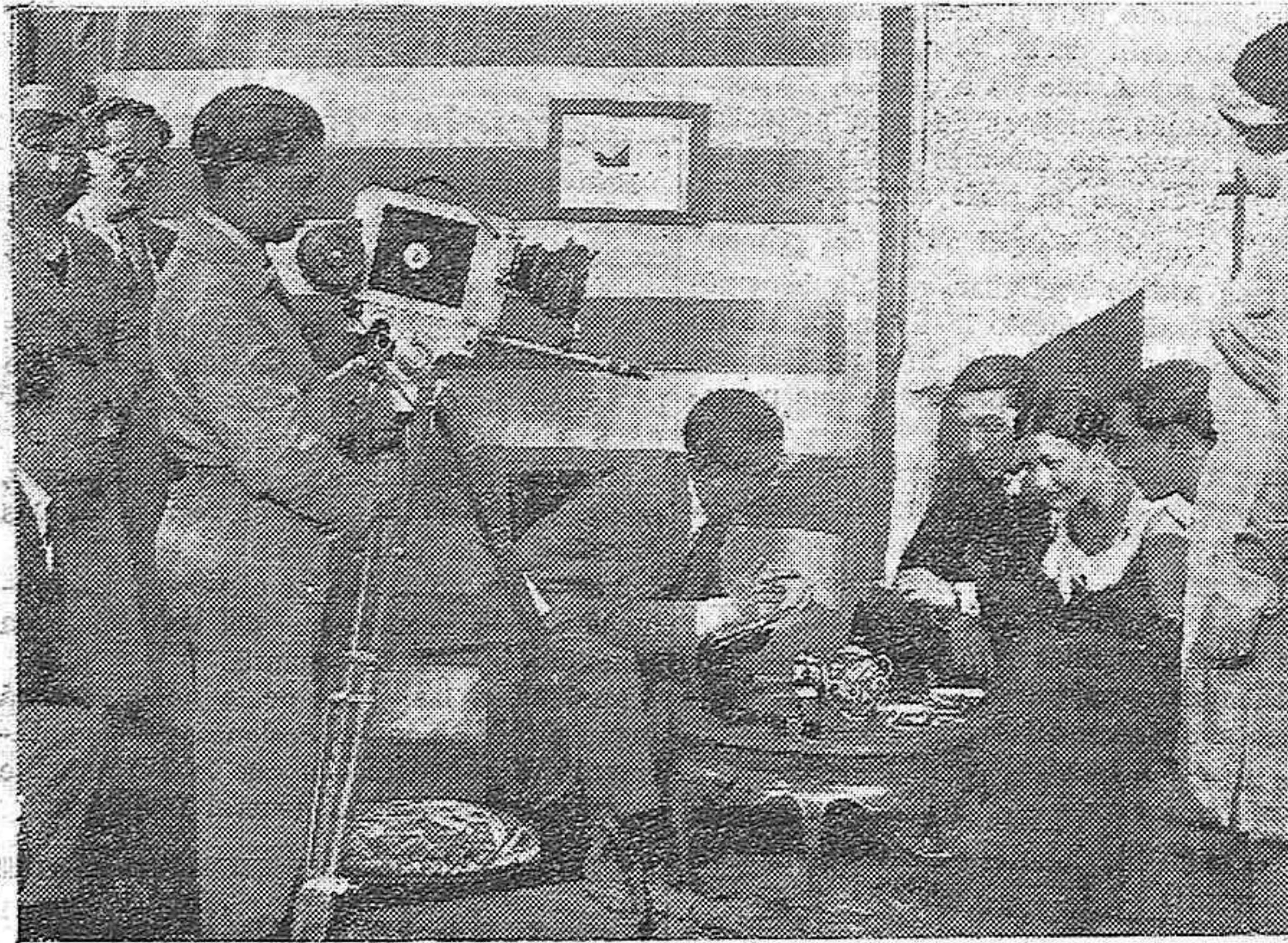
ARTISTAS ESPAÑOLES FILMANDO UN INTERIOR DE «EL SABOR DE LA GLORIA»