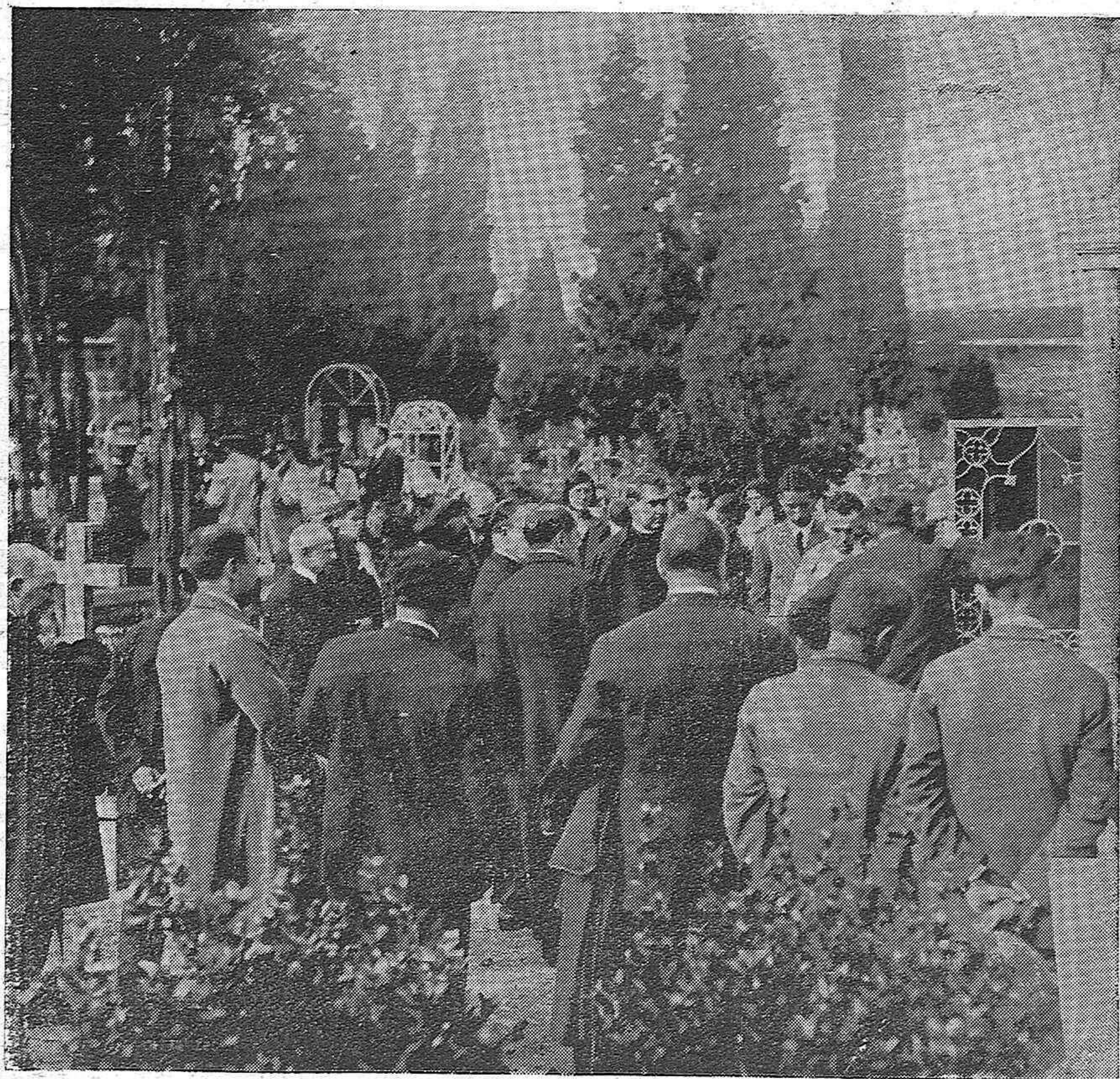
MADRID.— EN EL CEMENTERIO DE SAN LORENZO.—MOMENTO DE SER ENTERRADO EL CADAVER DEL GENERAL WEYLER EN EL PANTEON FAMILIAR, ANTE UN GRUPO DE PARIENTES Y AMIGOS