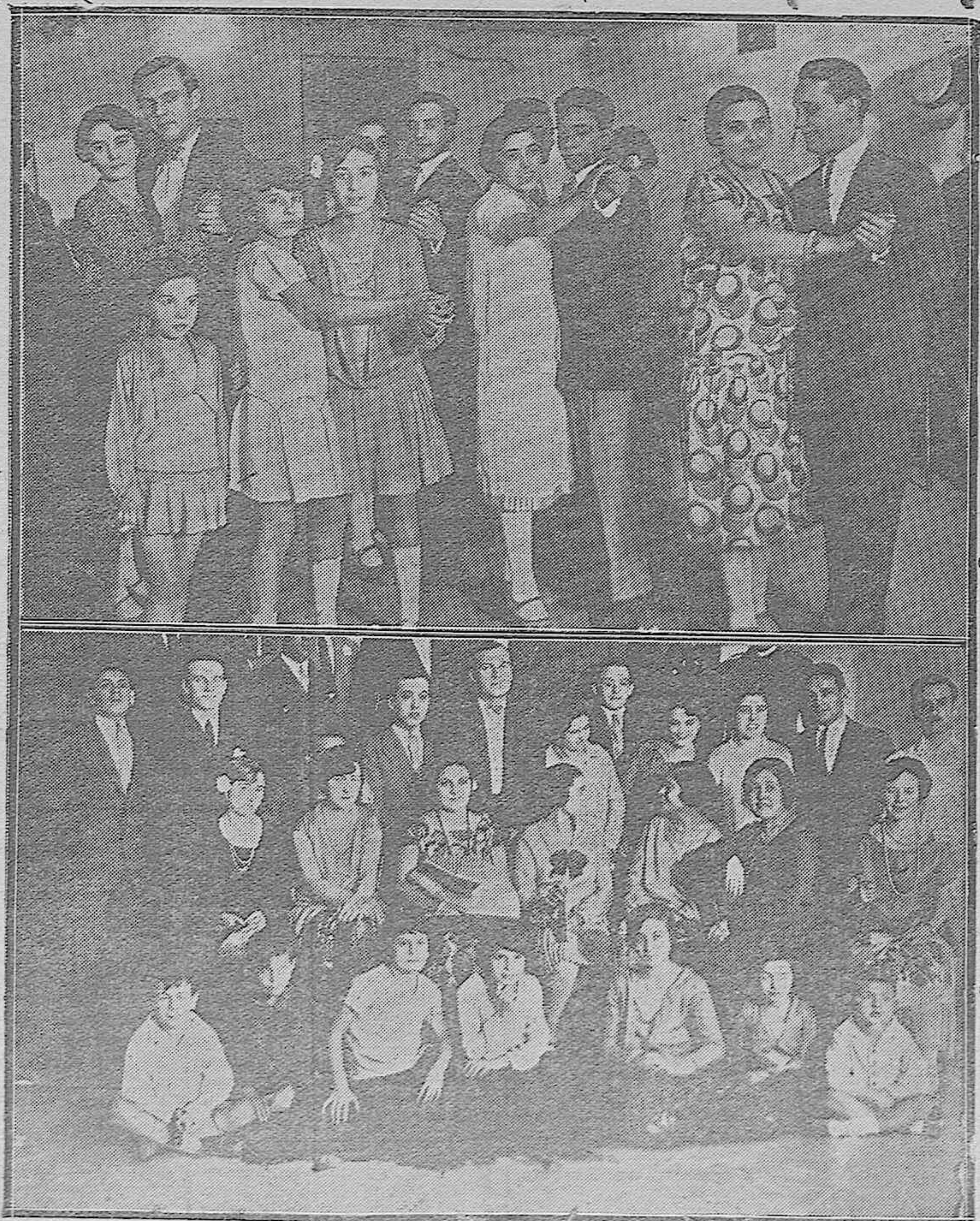
UNA VERBENA.—La Unión Mercantil Recreativa al celebrar la inauguración de su nuevo domicilio social, donde reúne bellas muchachas formando castizas parejas como se ven en la presente foto de Santos.