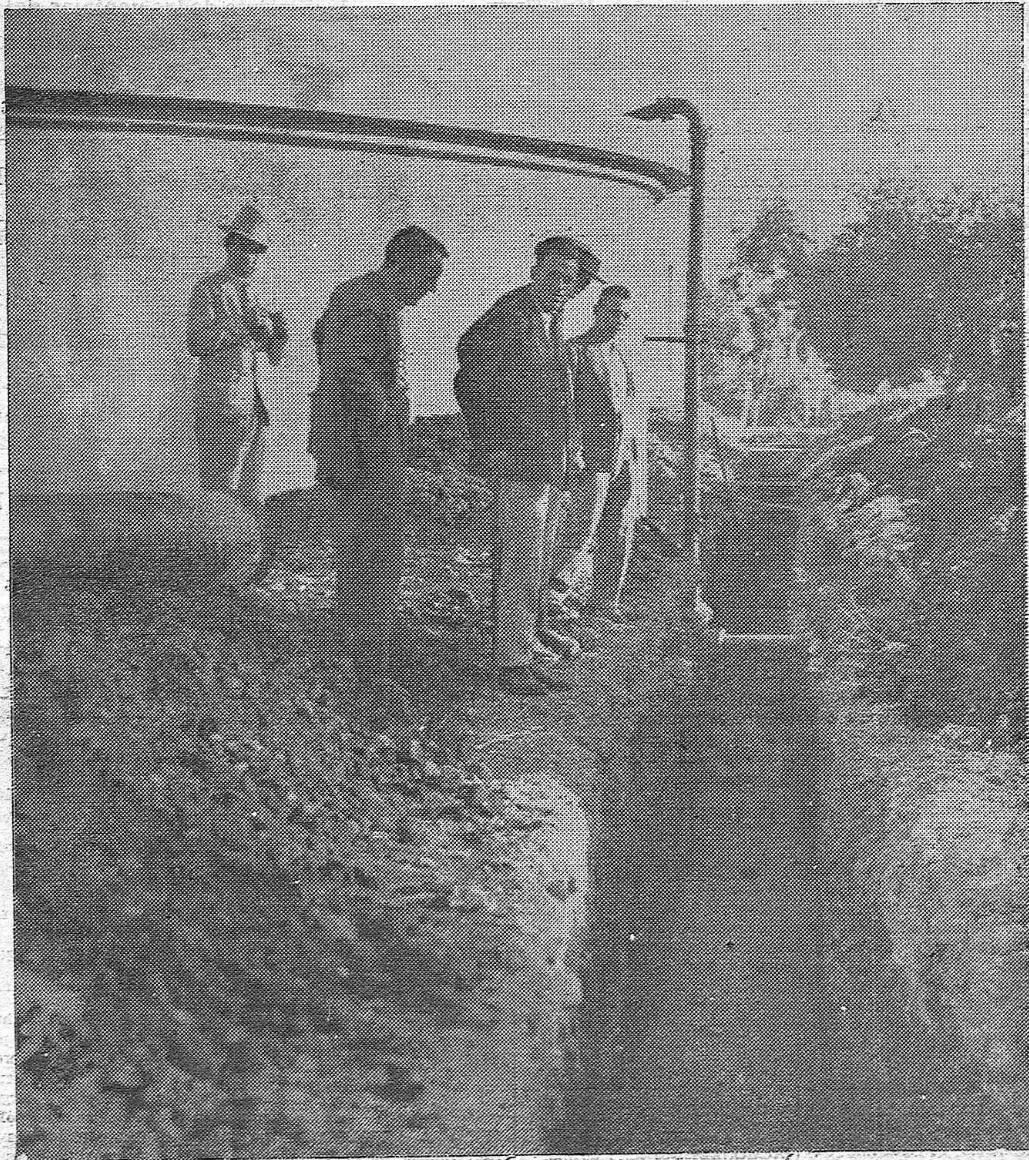
LA TRAJIDA DE AGUAS A CORDOBA.—La Comisión municipal inspeccionando las obras para la conducción de aguas a nuestra capital