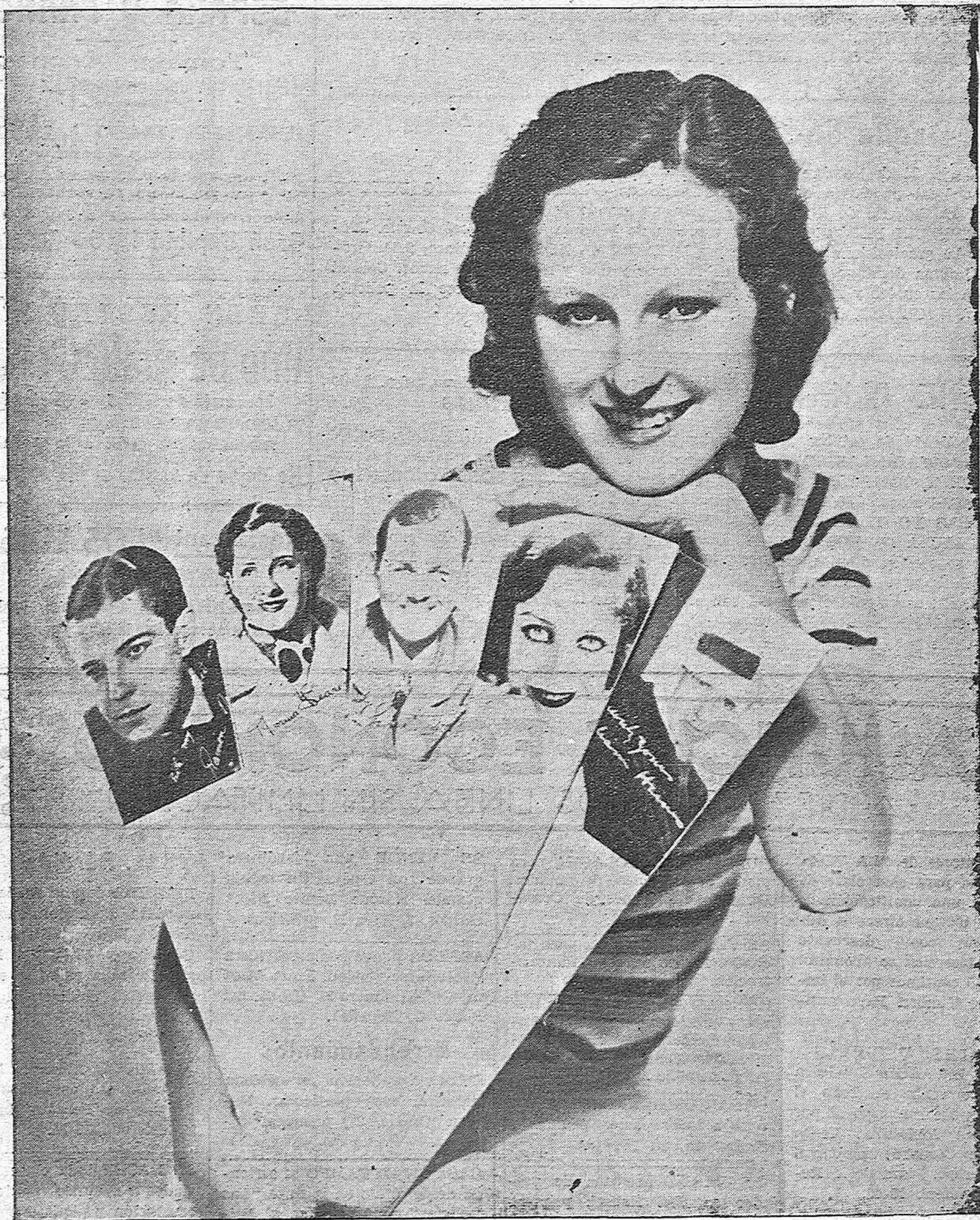
La bellissima Dorothy Jordán inicia una nueva moda de abanicos con retratos de "estrellas" cinematográficas a fuer de diseño. La idea armará desde luego una revolución en el mundo femenino