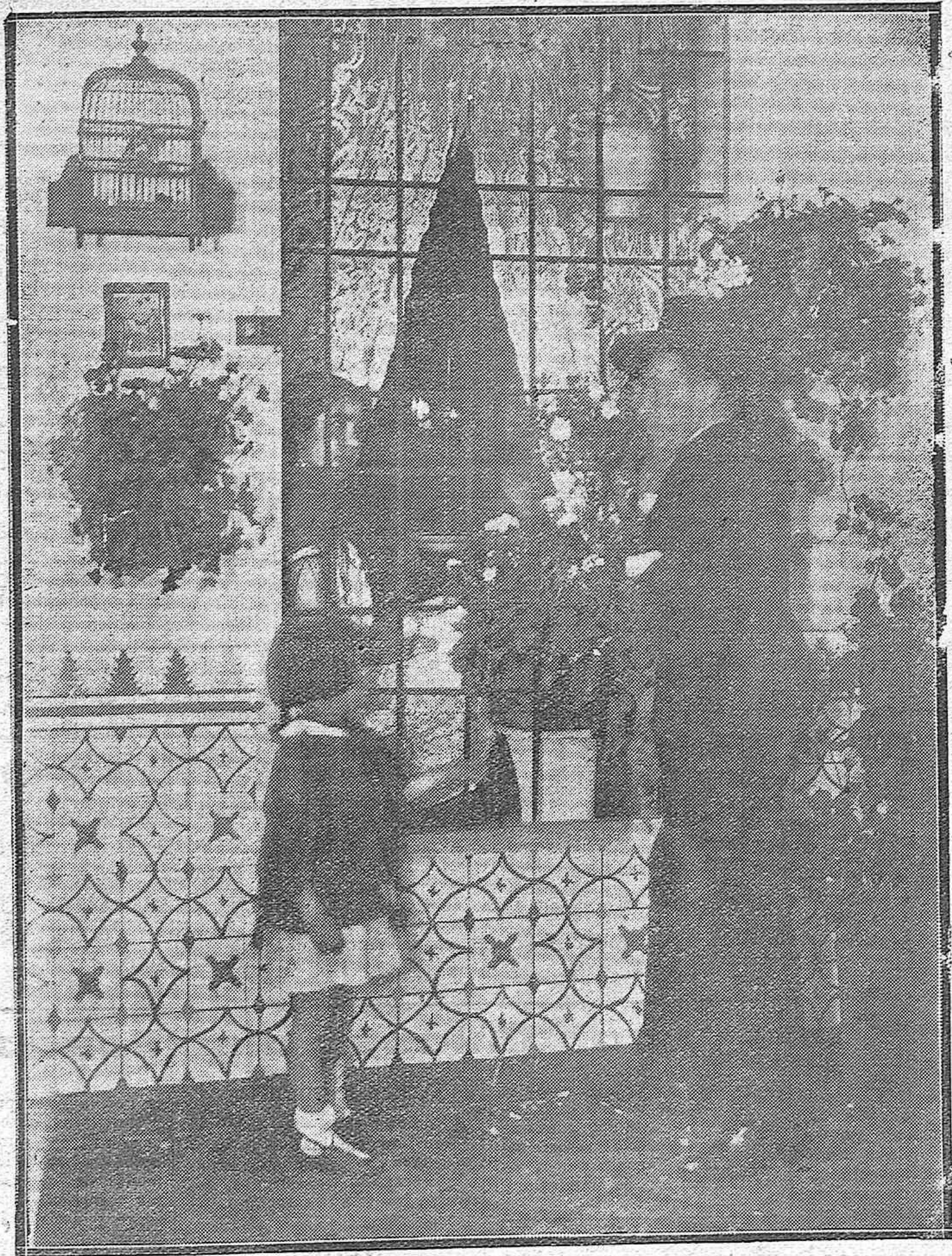
ESCENAS CORDOBESAS.—Un idilio interrumpido por una preciosa niña que pide limosna por el amor de Dios.