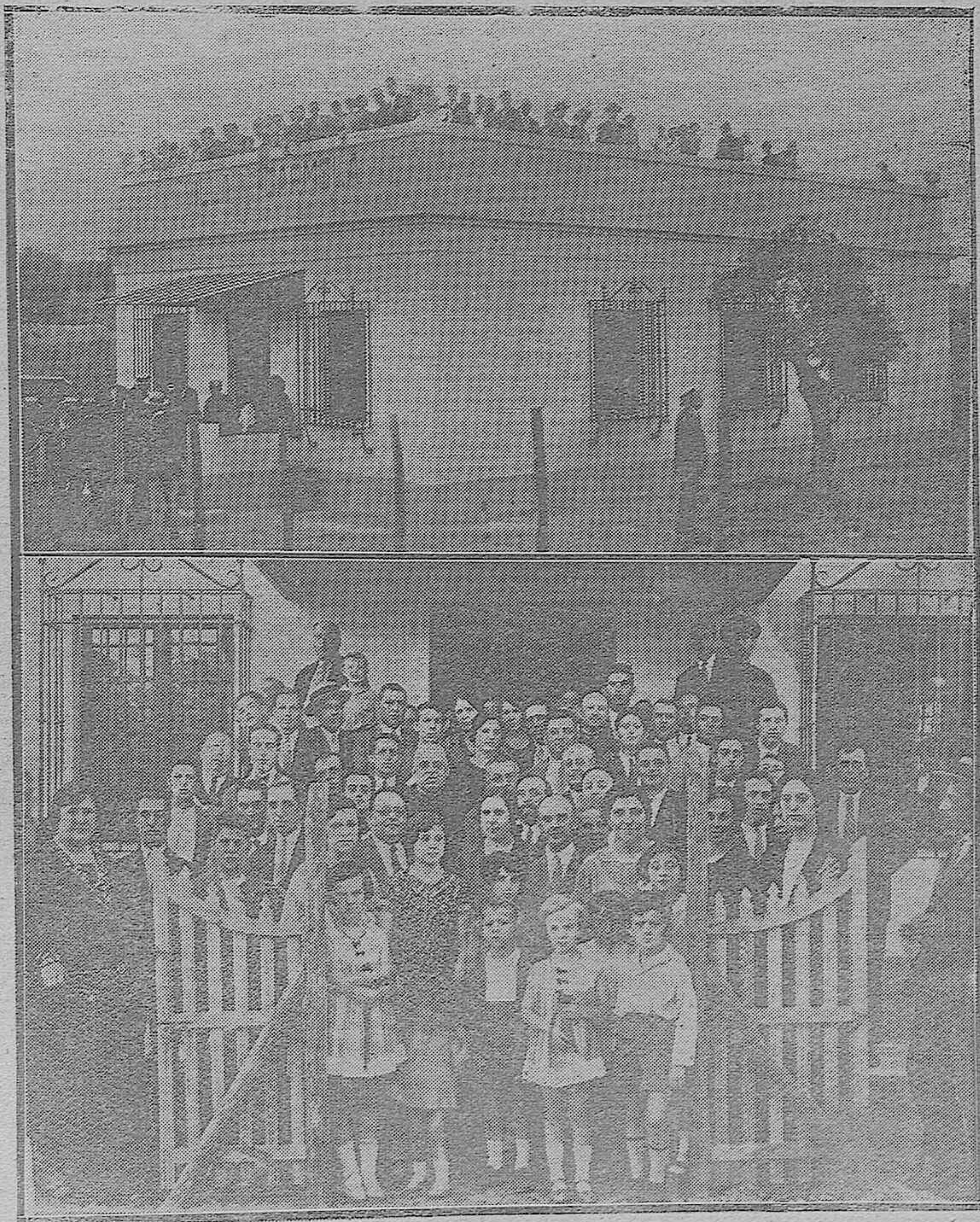
BELLA VISTA DE «VILLA CARMELA». — Crupo de concurrentes a la inauguración de «Villa Carmela», nueva casa del Banco de Ahorro y Construcción.