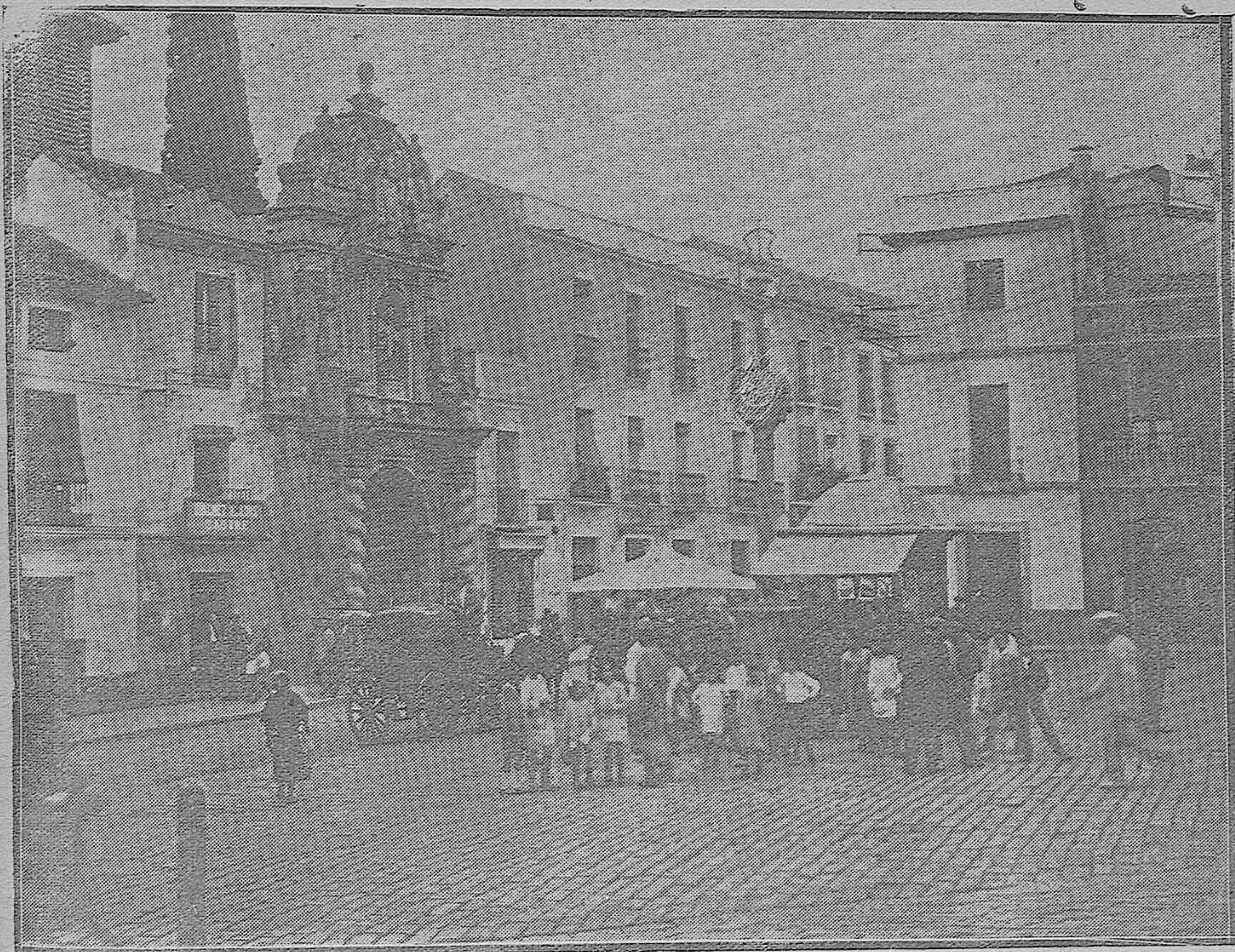
Una vista de la plaza del Salvador en las primeras horas de la mañana