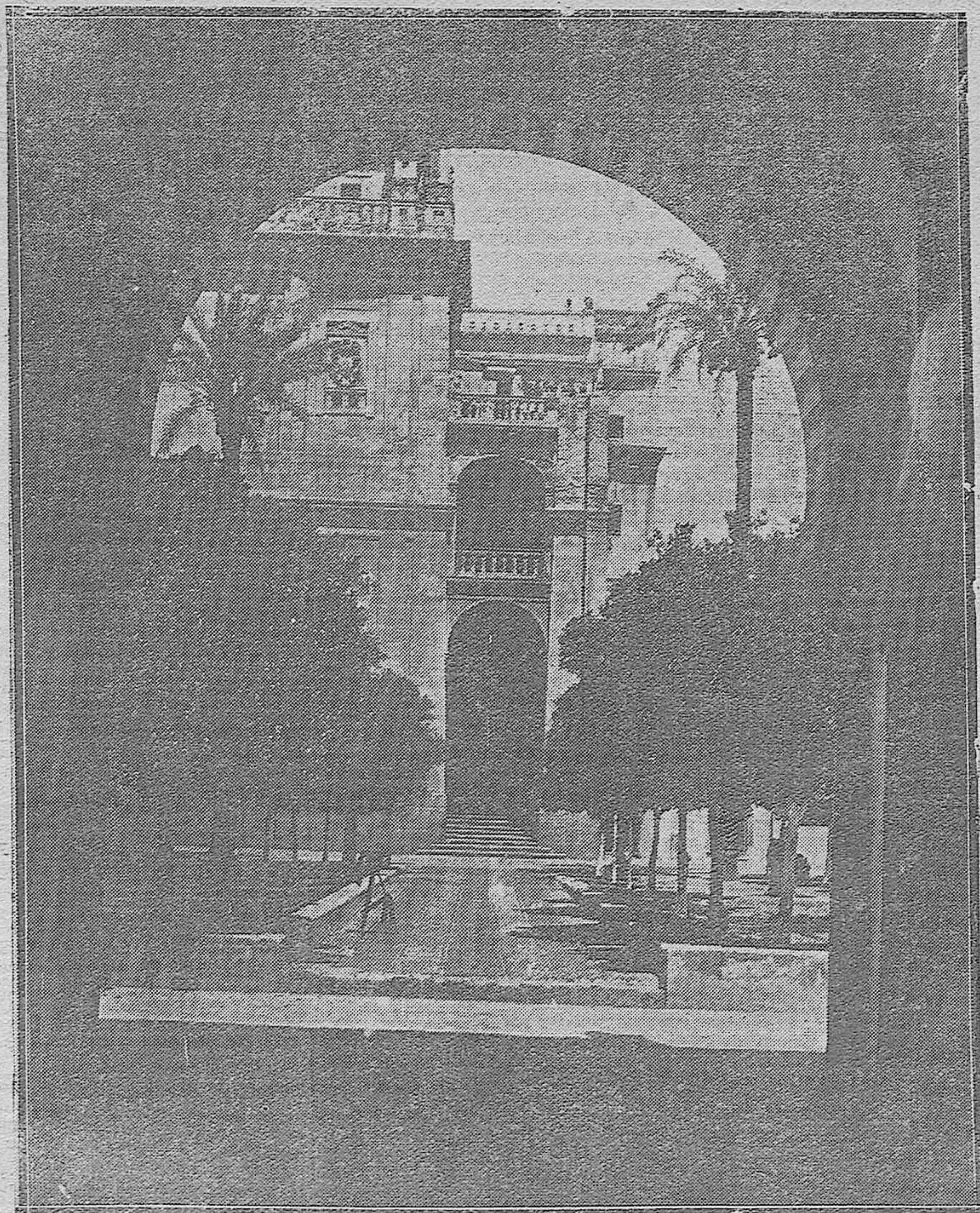
Bellísima vista de la Puerta del Perdón y parte del patio de los Naranjos, de nuestra Mezquita, tomada desde el interior de la misma.