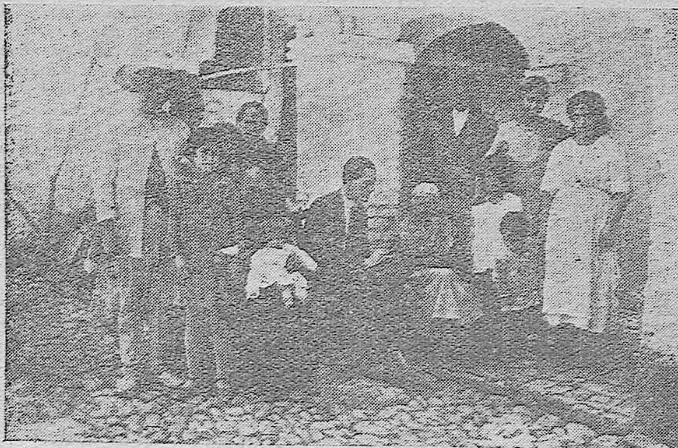
LA CENTENARIA DEL CAMPO DE LA VERDAD. F. FRIEND N. DEL L. ES DE SU VIDA