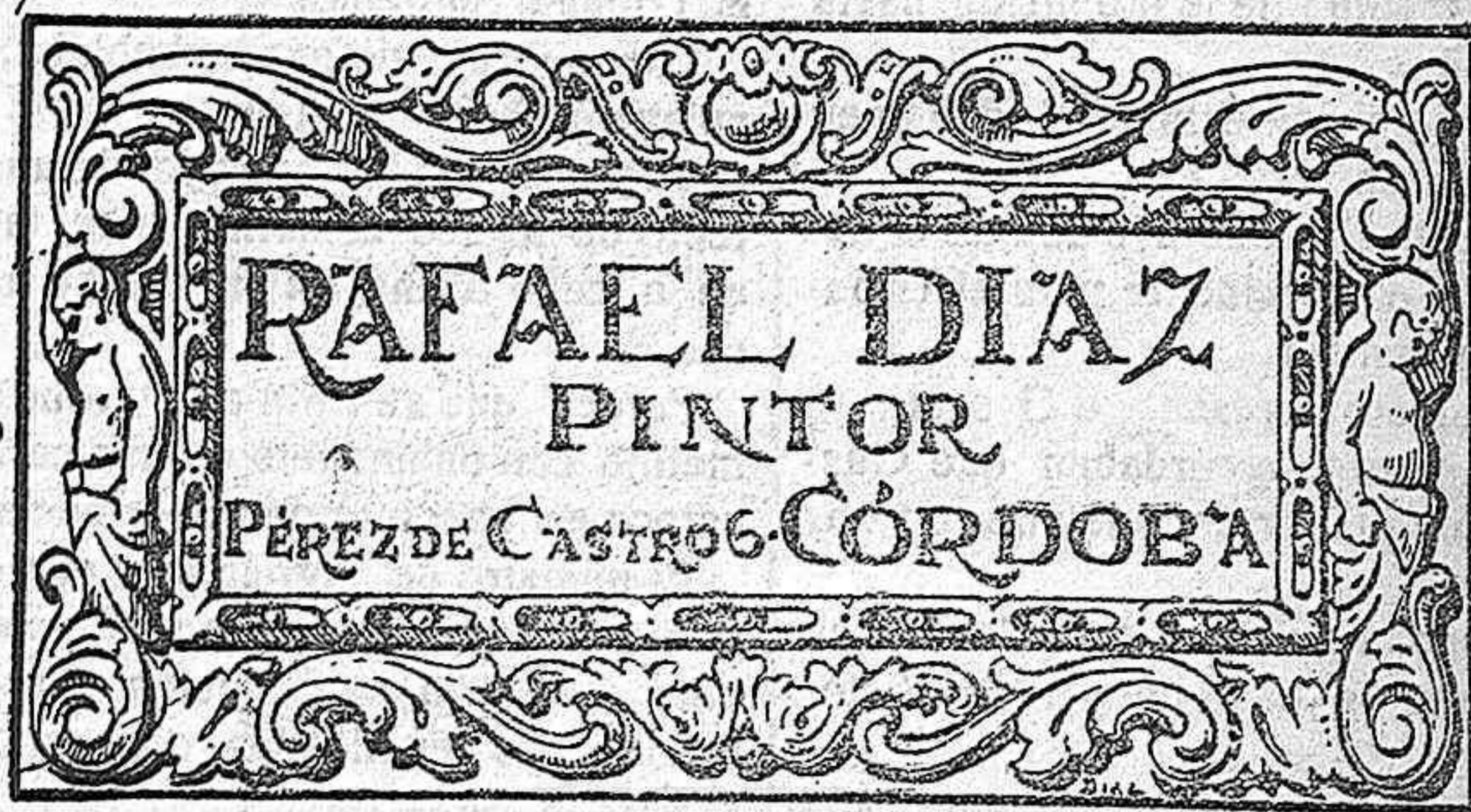
TALLA-DORADOS-RESTAURACIONES PAPELES PINTADOS - T.º 2122

Rechazad las imitaciones. En farmacias y droguerías, 1'80 pesetas. Por correo, 2 pesetas. FARMACIA PUERTO Plaza de San Ildefonso, 5.—MADRID