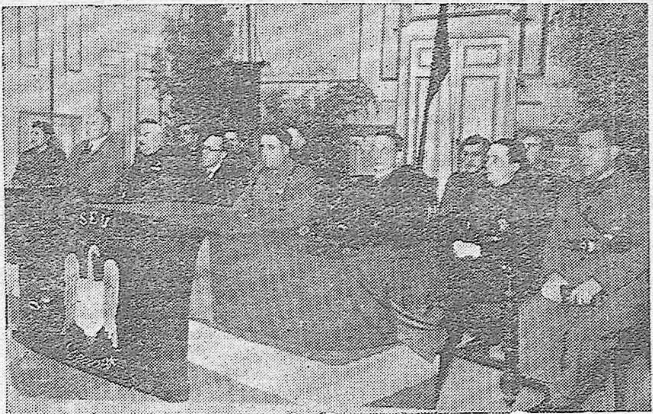
El acto del S. E. U. celebrado en el Gran Teatro.—Las autoridades y otras personalidades presidiendo.

Recordó las luchas sostenidas en las calles cuando el enemigo aechaba, y el fervor de la sangre de nuestra juventud lan-