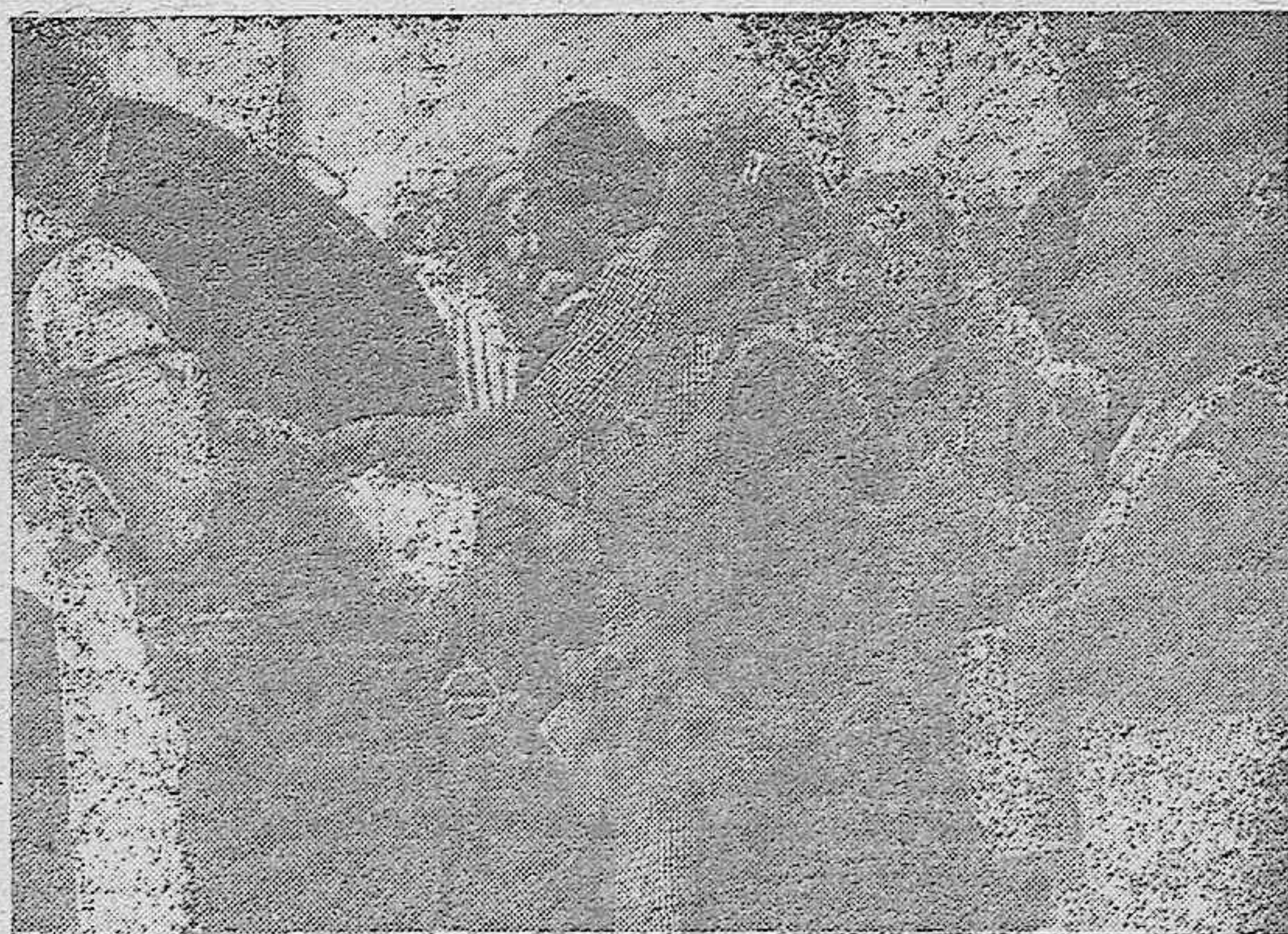
Cocina de la organización alemana de "Auxilio de Invierno" socorriendo con alimentos a la población civil de las ciudades de Polonia.