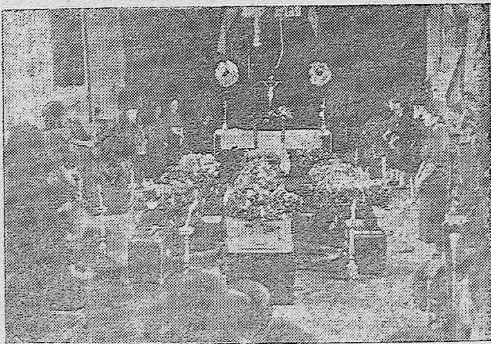
Capilla ardiente en que estuvieron expuestos los restos de los caídos, hijos de Pozoblanco, trasladados a su pueblo natal, de Tofana, Ciudad Real y Orihuela, y otros puntos. La inhumación constituyó una sentida manifestación de duelo el 10 de Septiembre actual.

La Hermandad de Nuestra Señora del Socorro, invita al pueblo de Córdoba por medio de AZUL, a este piadoso acto,