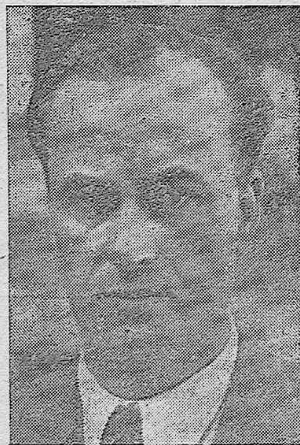
DON GERARDO SALVADOR Y MERINO, NUEVO DELEGADO NACIONAL DE SINDICATOS DE FALANGE ESPAÑOLA TRADICIONALISTA Y DE LAS JONS