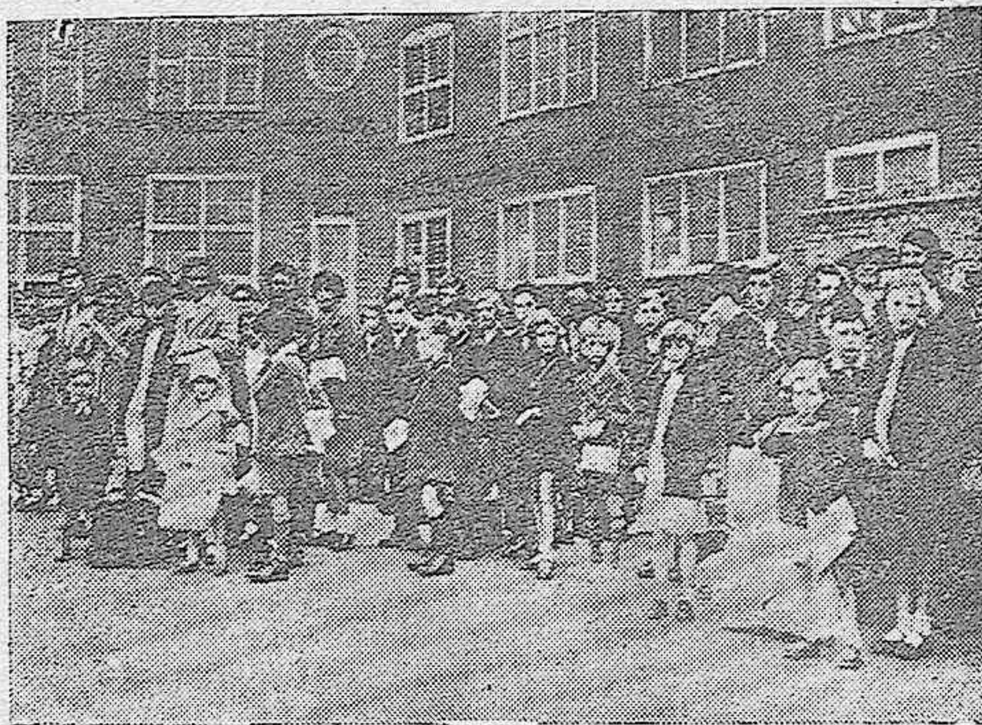
Más de seiscientas mil personas, en su mayoría mujeres y niños, han evacuado la ciudad de Londres, ante los actuales acontecimientos.—Niños de una escuela pública de Londres dispuestos para ser evacuados de la capital.

Roma, 8.—Los periódicos romanos comentan el rápido avance de las tropas alemanas en Polonia, sobre la capital, y prevén la próxima caída de la misma en poder de las fuerzas del Reich.