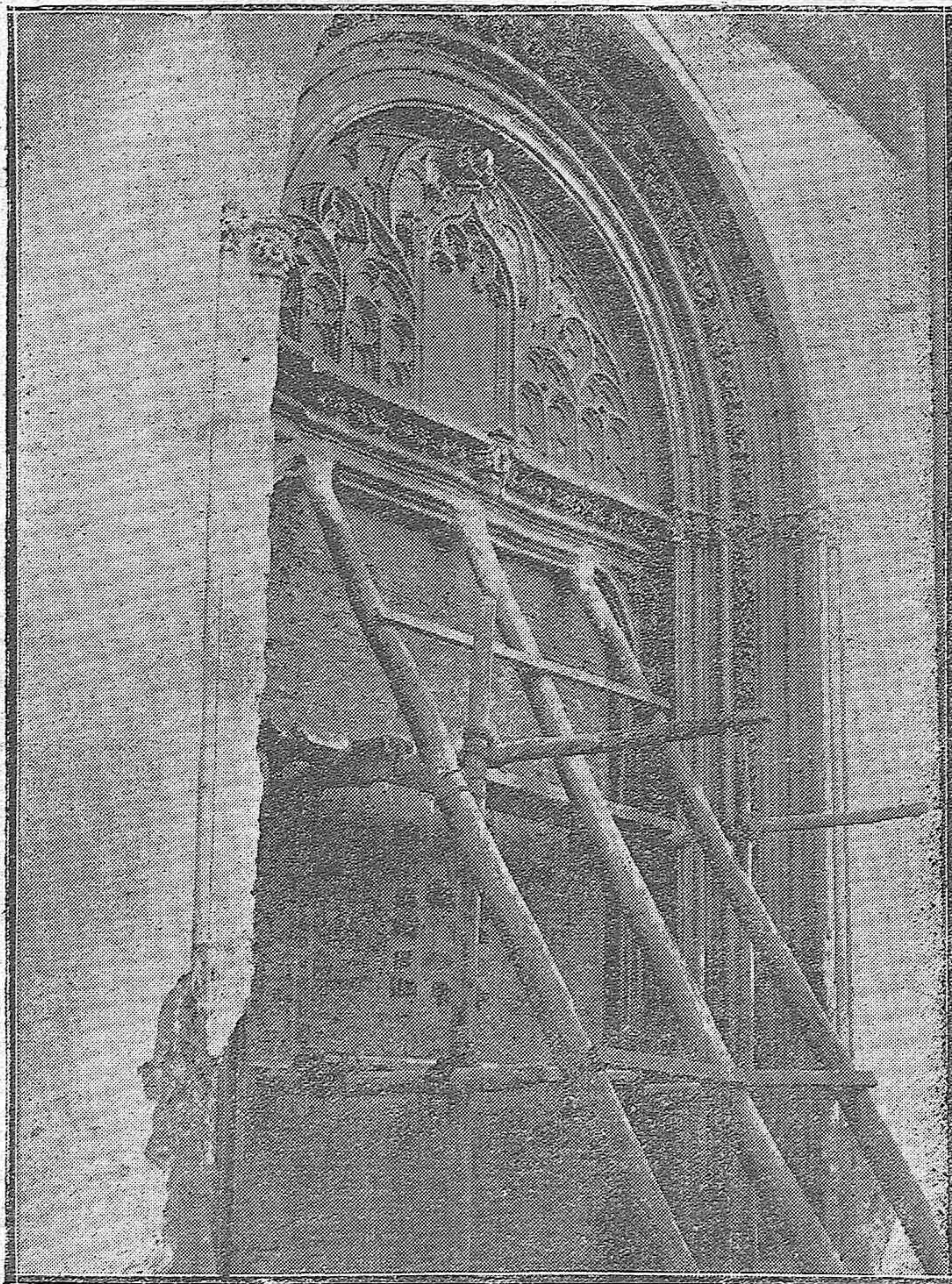
Primorosa portada gótica, descubierta recientemente en la iglesia parroquial de San Andrés.