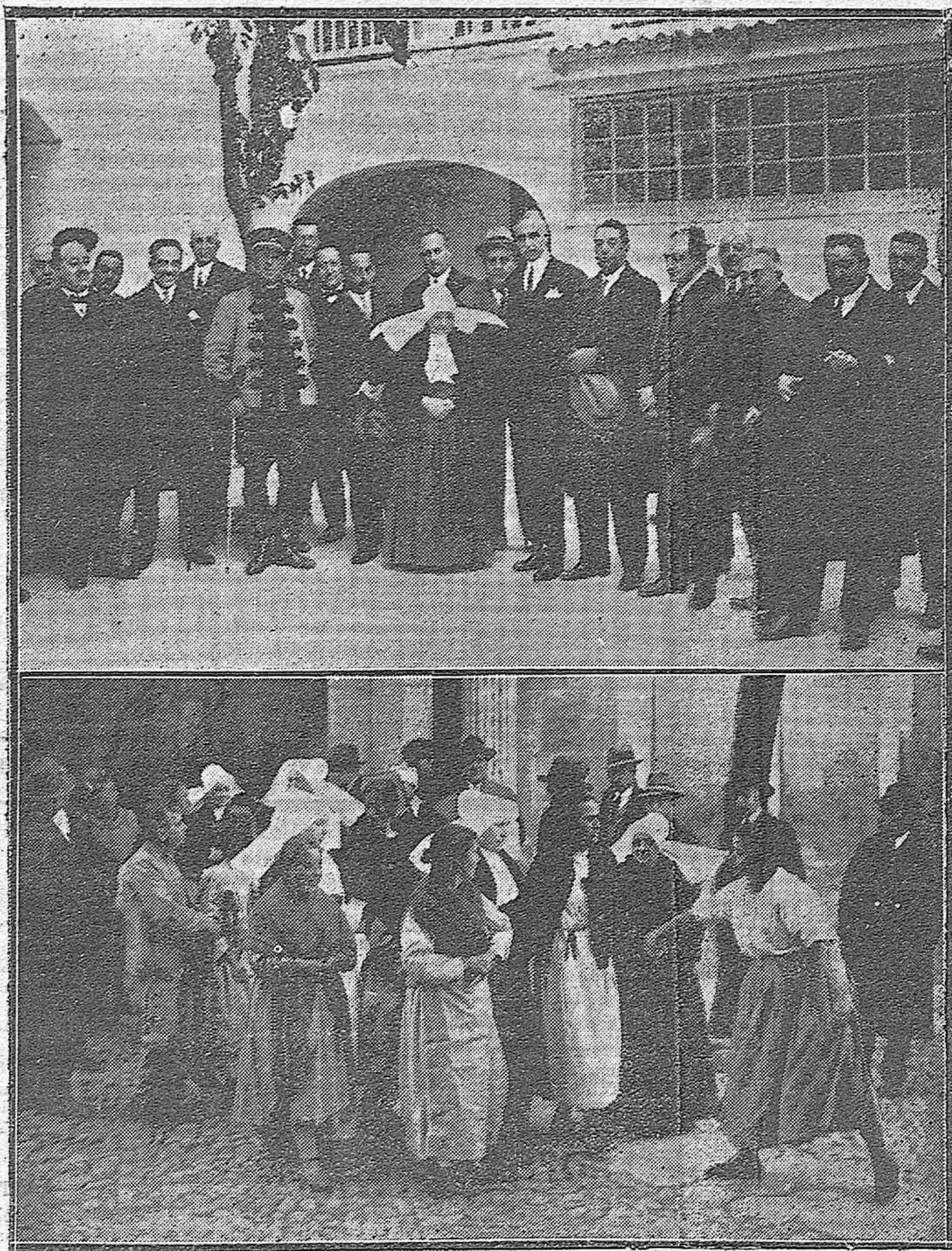
Dos momentos de la inauguración de los nuevos pabellones de dementes de San Pedro Alcántara. Autoridades y asistentes al acto.