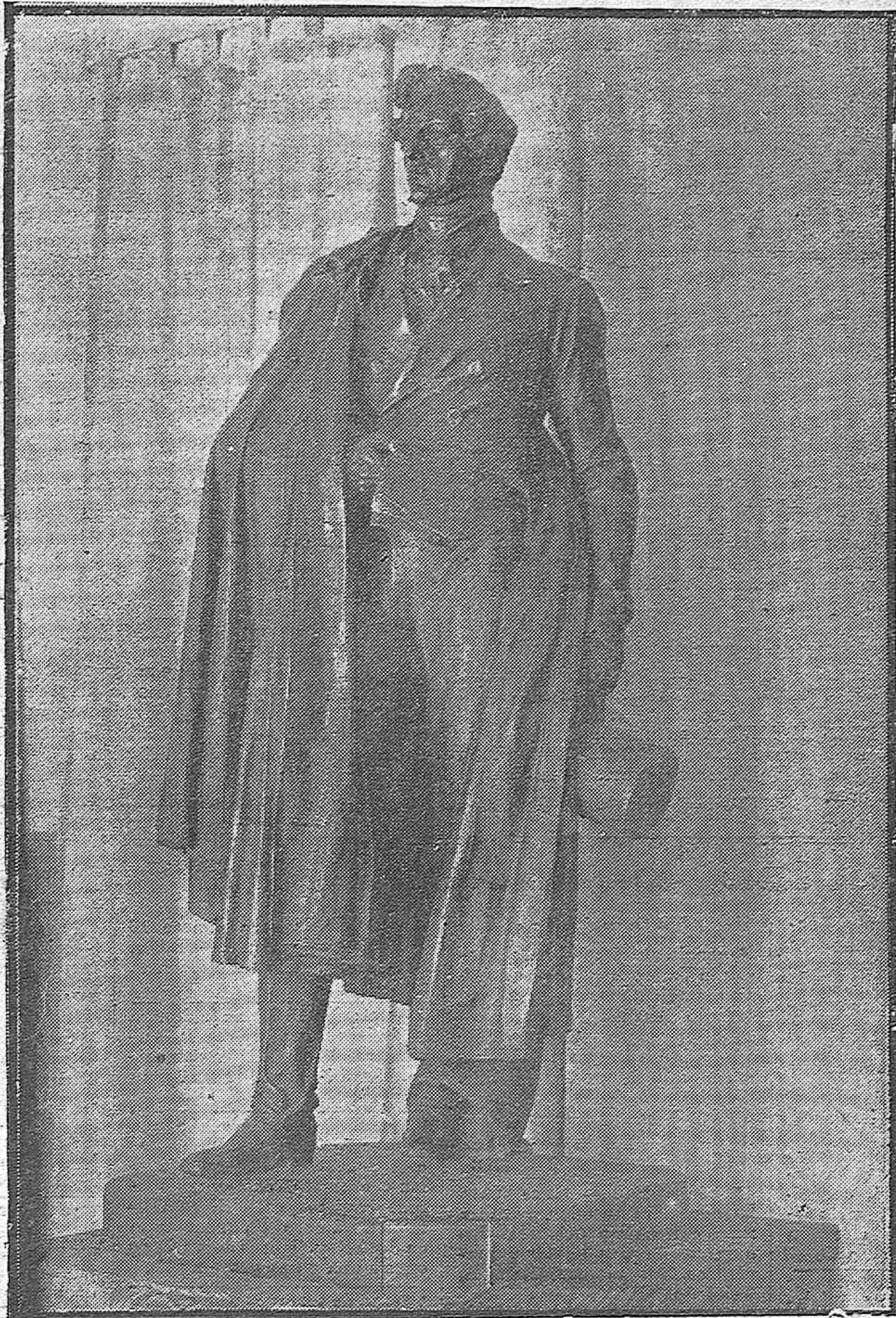
UNA OBRA DE ARTE.—Magnífica estatua en bronce del duque de Rivas, obra de don Mariano Benlliure, que será colocada en el proyectado monumento, expuesto por iniciativa del Alcalde don Rafael Cruz Conde en la planta baja del Ayuntamiento.