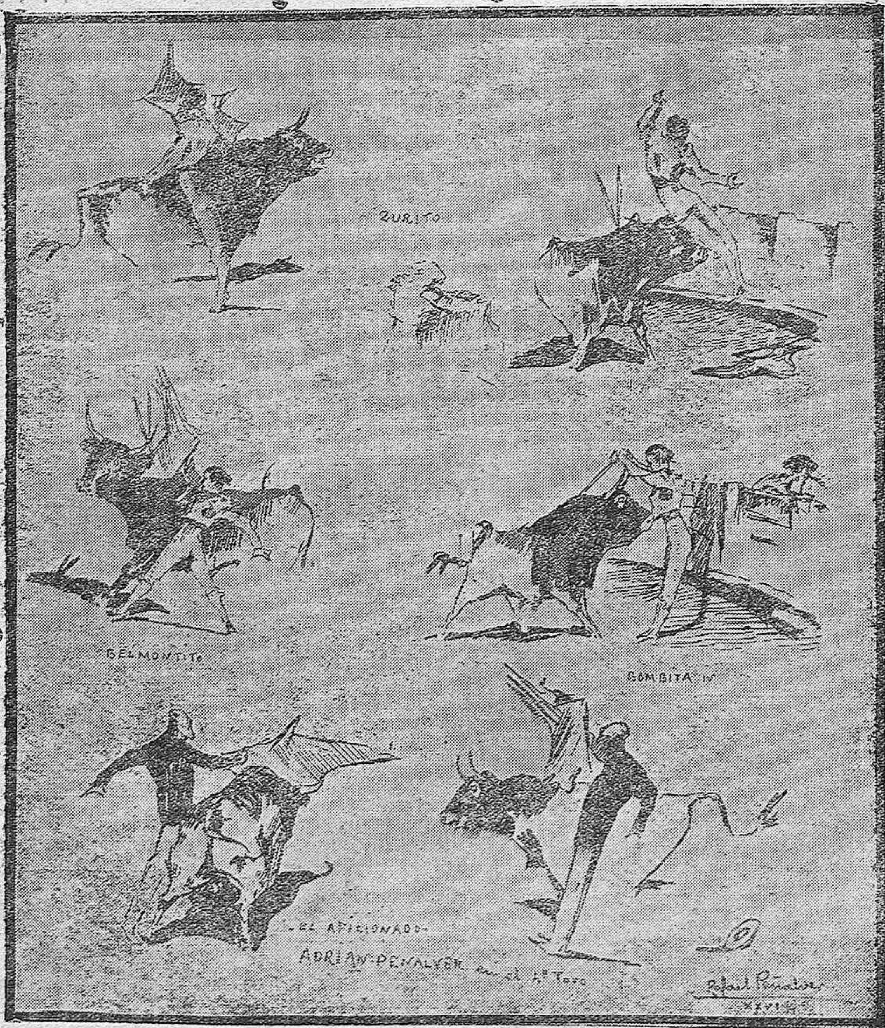
De la corrida a beneficio del Centro de Reporters de la prensa diaria local.—(Apuntes del natural por R. Peñalver.)